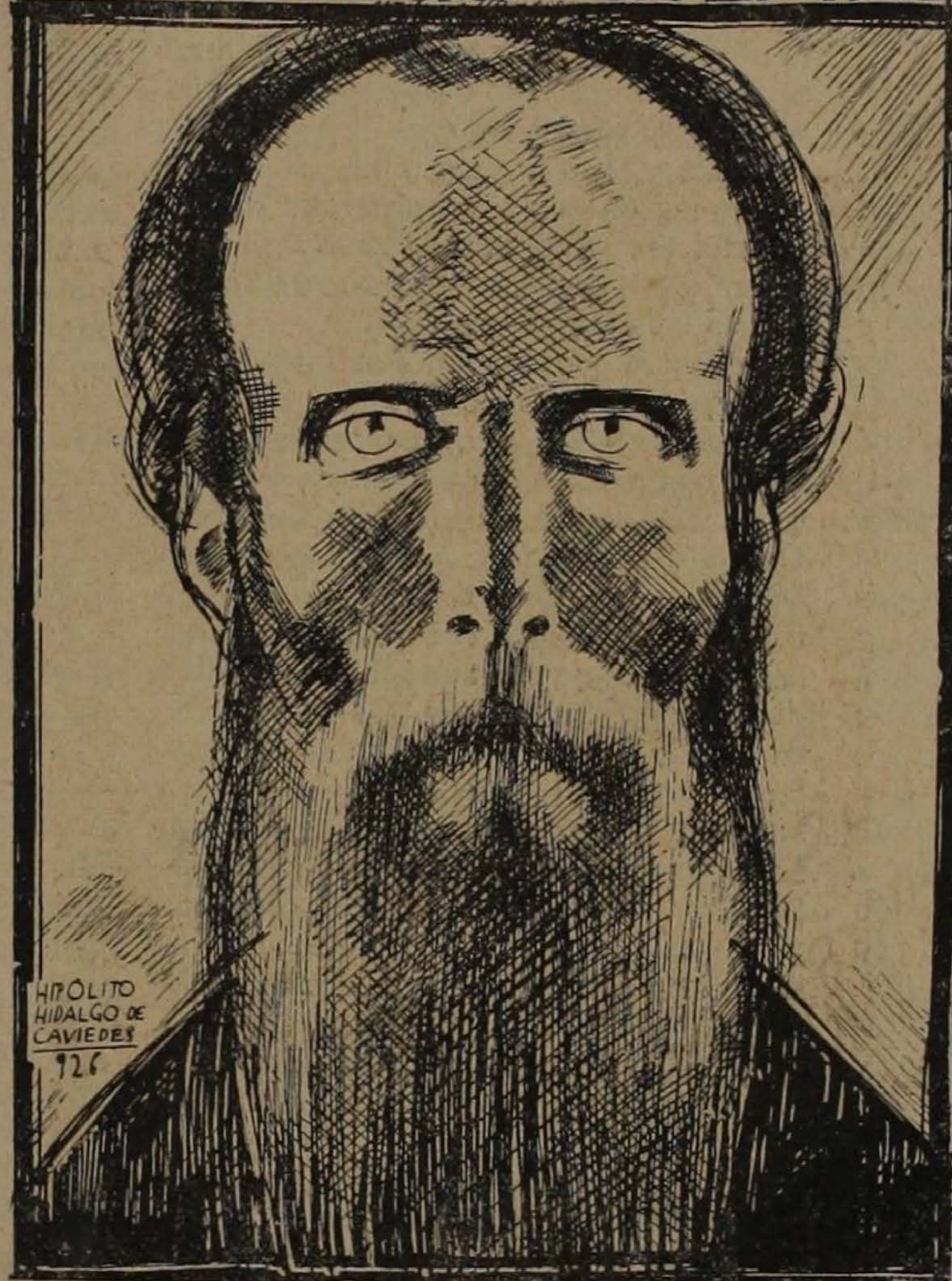
(Dibujo de HIPÓLITO HIDALGO DE CAVIEDES)