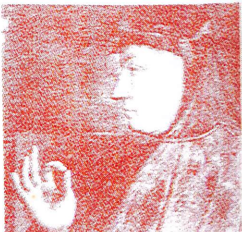
1 Giovanni Papini: Exposición personal , Luis de Caralt, Barcelona, 1965, trad. Alfonso Banda Moras.

Los hay que leen sentados a la mesa. Los hay que leen echados en las butacas o en las camas. No les juzgo; es más: como hermano, los perdono. Pero jamás he comprendido mejor y saboreado tanto un libro como cuando lo he leído al aire libre, bajo el cielo amigo que protege campos y montañas, sentado en la hierba, o sobre una peña, con el bastón al lado, un cigarrillo en los labios y el lápiz en la mano. Aquí donde cantaban los pastores míticos, donde rogaban los ermitaños y los solitarios observaban los astros, ha quedado algo de la silenciosa rarefacción deseada por todos los contemplativos, con el fin de llegar a ser —según quieren Walt Whitman y Chateaubriand— lo que se mira. El aire, aquí arriba, es más sutil y puro no solo en el sentido físico sino en el sentido espiritual también. Menos peso en la cabeza, menos impedimentos en el alma, menos asaltos e insidias en los sentidos. Los libros de los santos, leídos en el despacho, en la ciudad amaestrada y sosiegada; y a cierta altura, entre verde de hojas y azul celeste de horizontes, convencen, alientan, encantan. Y aquellos poetas que gustan de ser leídos a la luz de una bombilla eléctrica, releídos en la limpidez de las colinas arrebatadas y casi embriagadas.