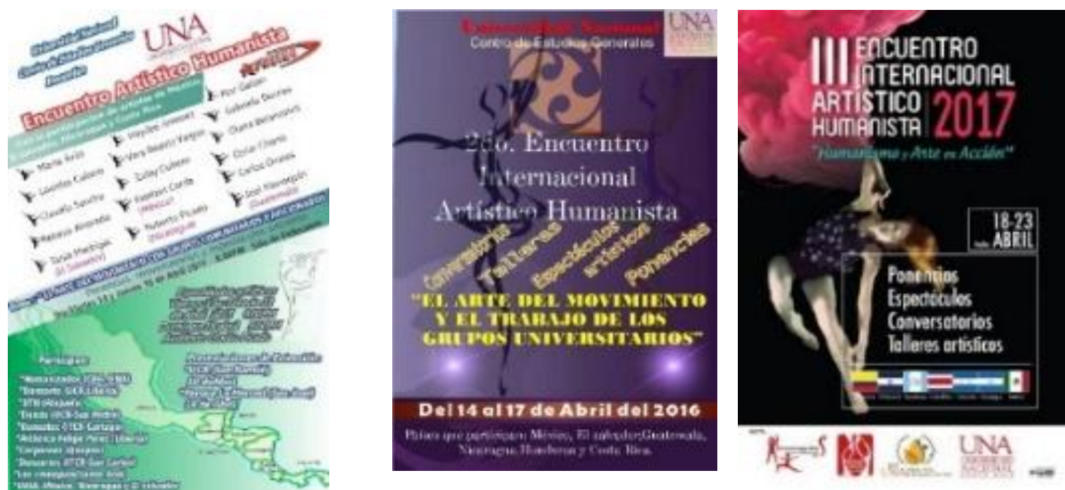
Figura 2. Afiche y programa de los I II y III Encuentros realizados