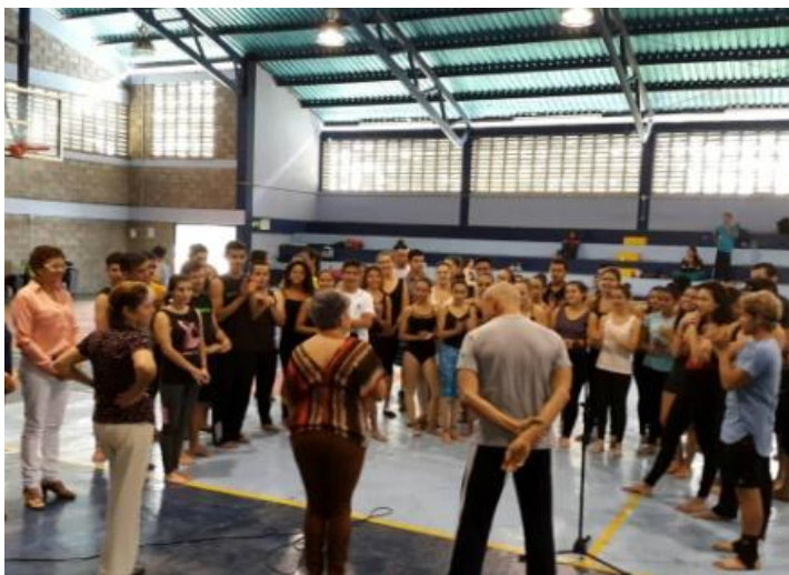
Figura 11: San Ramón. UCR. Sede Occidente