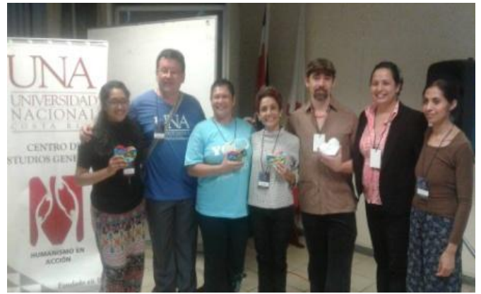
Figura 4: Conversatorio con directores internacionales