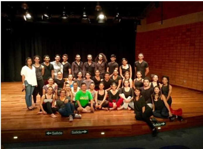
Figura 9: Cartago, ITCR