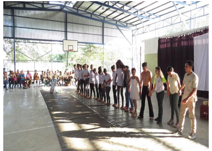
Figura 10: Liberia, UCR. Sede