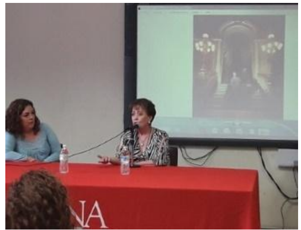
Figura 5: Conferencias con artistas nacionales