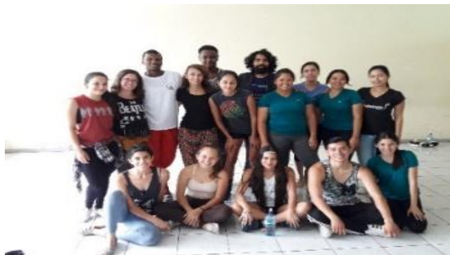
Figura 6: Talleres impartidos a integrantes de todas las agrupaciones