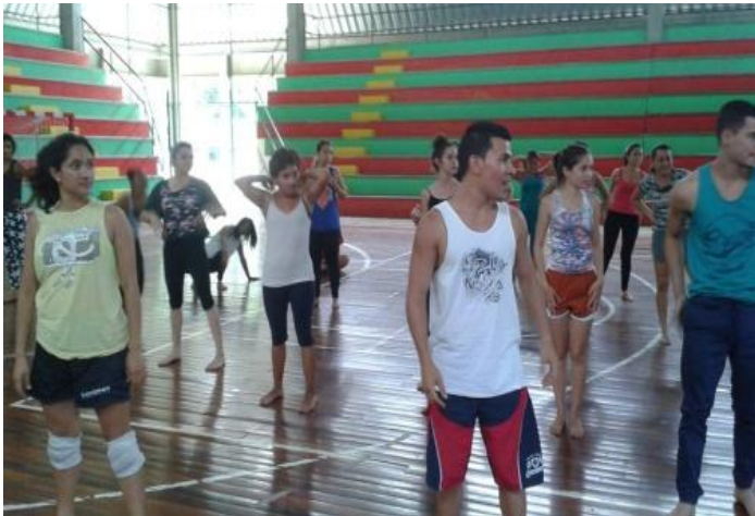
Figura.7: UCR. Sede Caribe