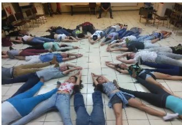
Figura 1. Ejercicios creativos del II encuentro

En nuestras sociedades, tanto los artistas como los científicos y empresarios son modelos ejemplares de la innovación. No es de sorprender que se diga que la educación artística es un medio para desarrollar las habilidades consideradas fundamentales para innovar: pensamiento crítico y creativo, motivación, confianza en sí mismo, capacidad para comunicarse y cooperar de manera eficaz, además de otras habilidades del ámbito académico ajenas al arte, como las matemáticas, la ciencia, la lectura y la escritura. (2013, p. 23)