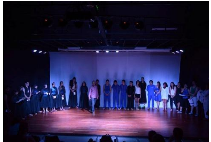
Figura 8: San Carlos, ITCR