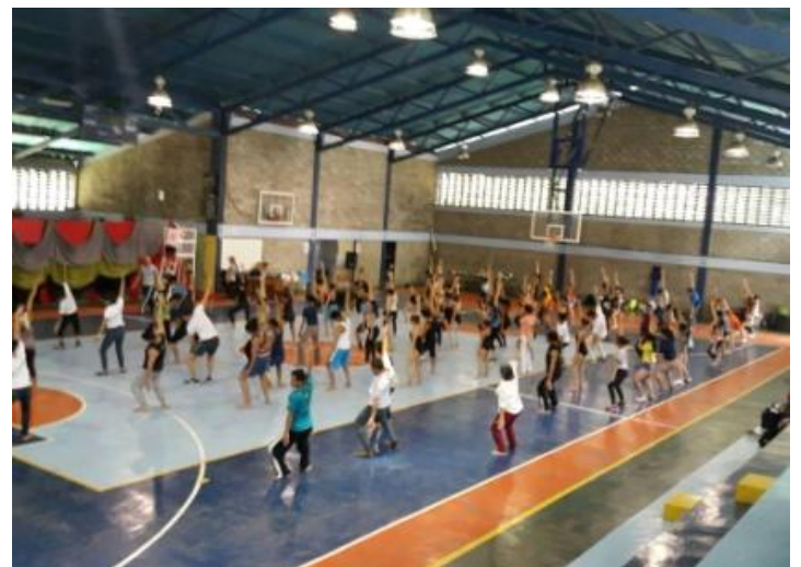
Figura12: Cartago, ITCR