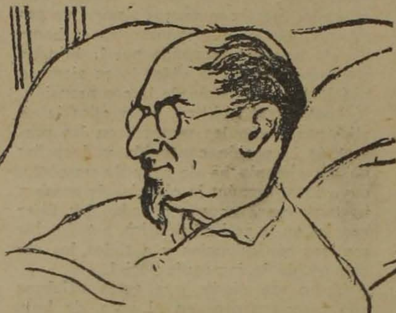
Lunatcharsky (Último retrato, por Bor. Espinow)

A la propaganda del libro y el cuadro, siguió la del escenario y la pantalla. Compañías teatrales y equipos fílmicos fueron destacados por toda la Rusia Soviética. Terminadas las tareas en el campo o en el taller, se brindaba a los trabajadores el remanso espiritual de las representaciones histriónicas o de las proyecciones películeras. Y como Lunatcharsky fué toda su vida un apasionado admirador de "El Quijote", hizo que tanto en el tablado de la farsa como en el cuadrilátero de la pantalla