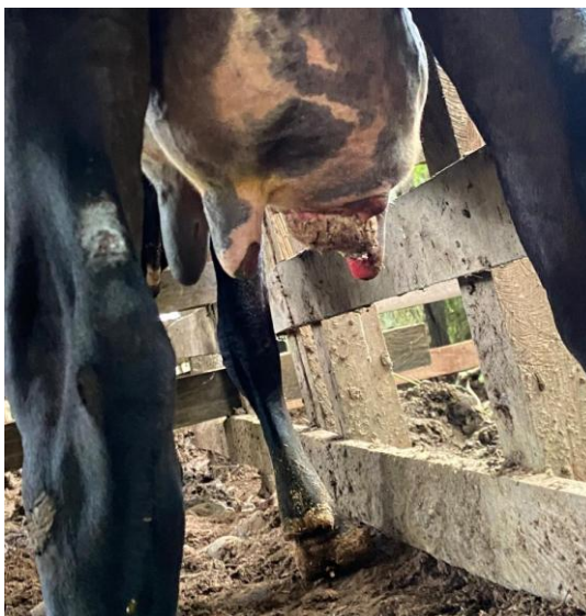
Figura 5. Mastitis secundaria a fiebre de leche en novilla de primer parto.

El otro caso de mastitis se presentó de forma secundaria a una patología conocida como fiebre de leche en una novilla de primer parto (Figura 5).