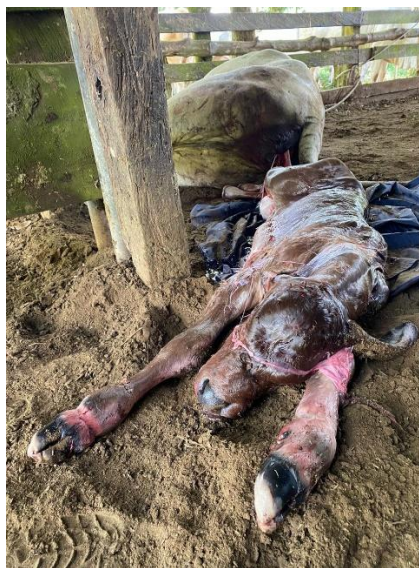
Figura 4. Atención de parto distócico en finca La Joya.

minimizar los posibles daños a la madre. No obstante, al momento de la extracción, el ternero ya se encontraba fallecido (Figura 4). El manejo de esta hembra fue complementado con la aplicación de fármacos antiinflamatorios/analgésicos y oxitocina para estimular las contracciones uterinas y facilitar la expulsión de los restos placentarios (Magata et al., 2021).