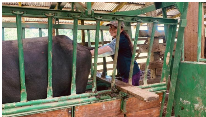
Figura 3. Palpación rectal como método de diagnóstico reproductivo utilizado en la pasantía.

Por medio de este método, los hallazgos obtenidos fueron clasificados de la siguiente manera: anestro, en ausencia de cuerpo lúteo; ciclicidad, con la presencia de cuerpo lúteo; celo, al reconocer un aumento en el tono uterino acompañado de un folículo ovárico dominante; preñez, al identificar uno o más de los cuatro signos específicos (deslizamiento de membrana, vesícula amniótica, placentomas, feto); o patología, al detectar cualquier anomalía durante la palpación (Balhara et al., 2013; Hopper, 2021). En ese sentido, el Cuadro 2 muestra el diagnóstico reproductivo obtenido en las vacas de las fincas visitadas.