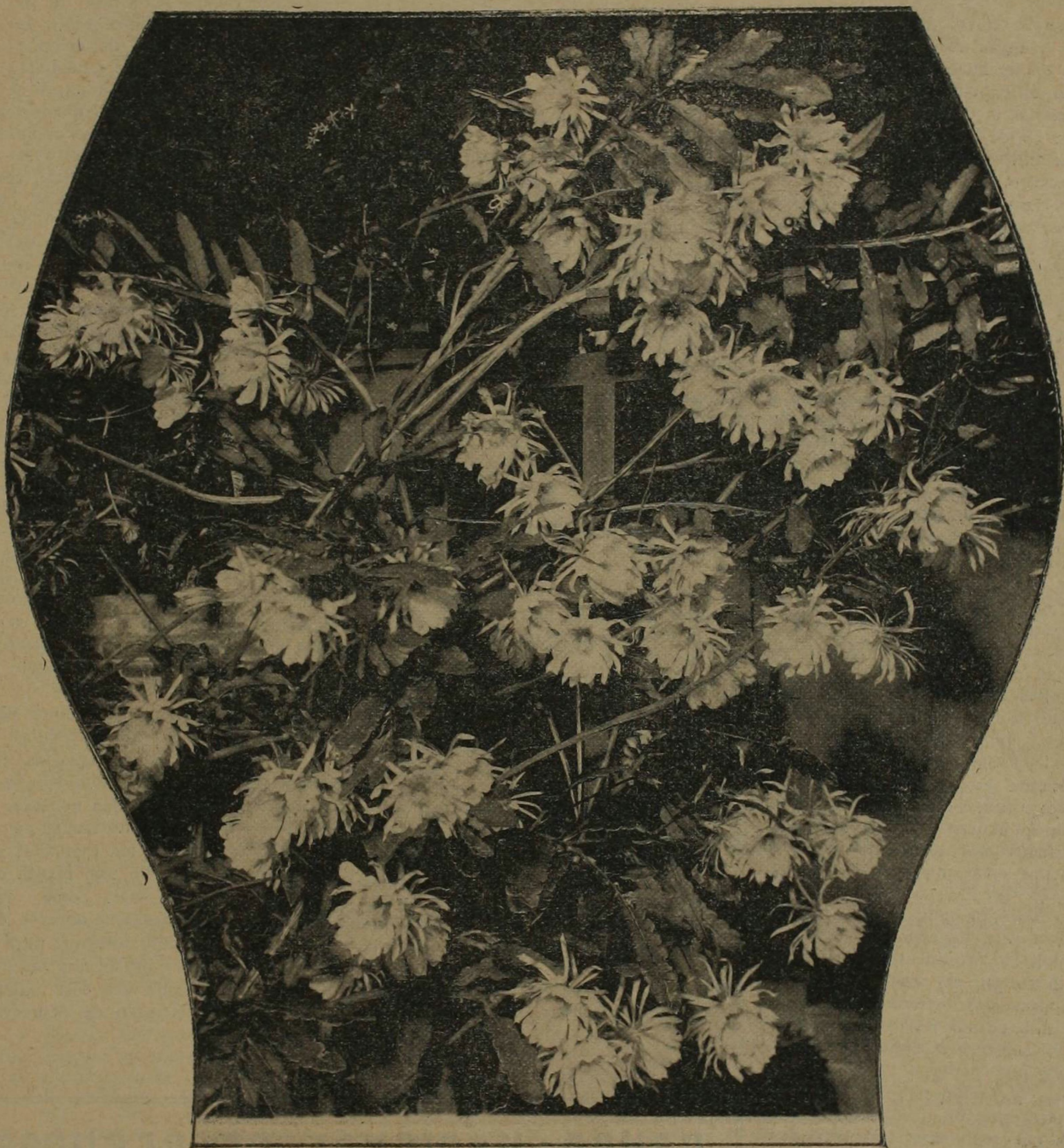
La reina del baile. Epiphyllum macropterum (Lemaire)

Fotografía tomada a media noche, con luz de magnesio, el 17 de Mayo de 1933, en San José de Costa Rica.