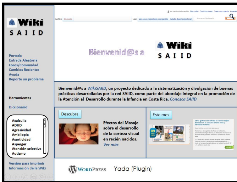
Figura 1. Esquema de Wiki (página principal)

Se buscará desarrollar una Wiki, similar a la que se muestra como ejemplo en la imagen superior. La misma contará con un índice de búsqueda desde el cual explorar conocimientos teórico-prácticos relacionados con diversos diagnósticos o situaciones educativas de interés. Además se contará con secciones de avisos y noticias para motivar el aprendizaje.