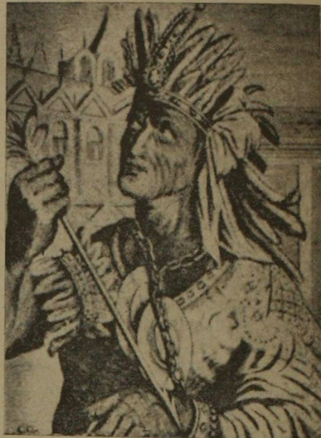
El Inca Atahualpa, último rey del Perú

No robar, no matar, no estar ocioso era el triple lema diamantino de tu Imperio. Pero estos mataron, y mintieron y vivieron todos del latrocinio y de la espada. Pero tú, en tu cautiverio, sin maskai pacha y sin litera, con sólo ojotas eras mayor que todos.