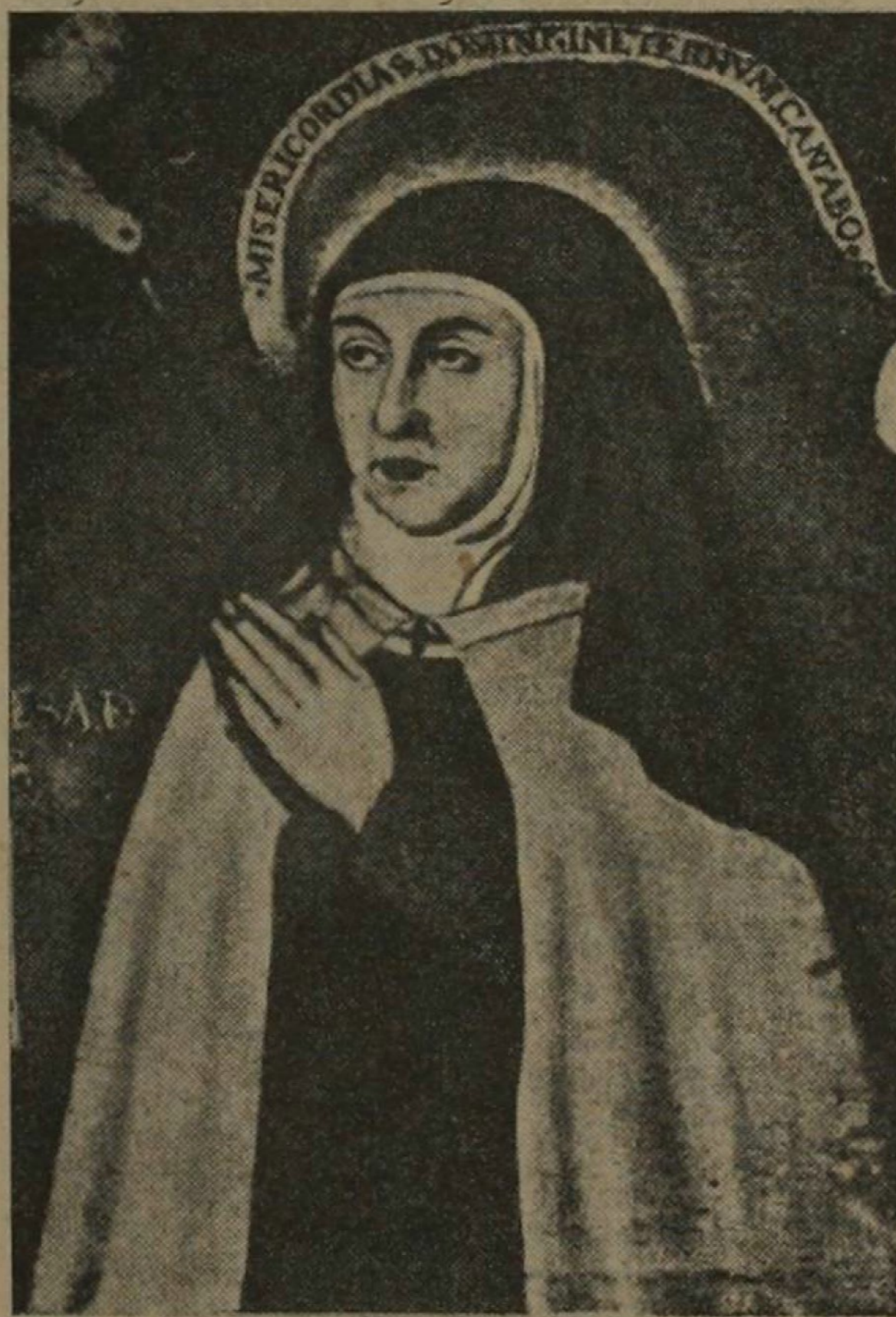
Santa Teresa de Jesús

= De La Prensa.—Buenos Aires, 10, febrero, 1935 =