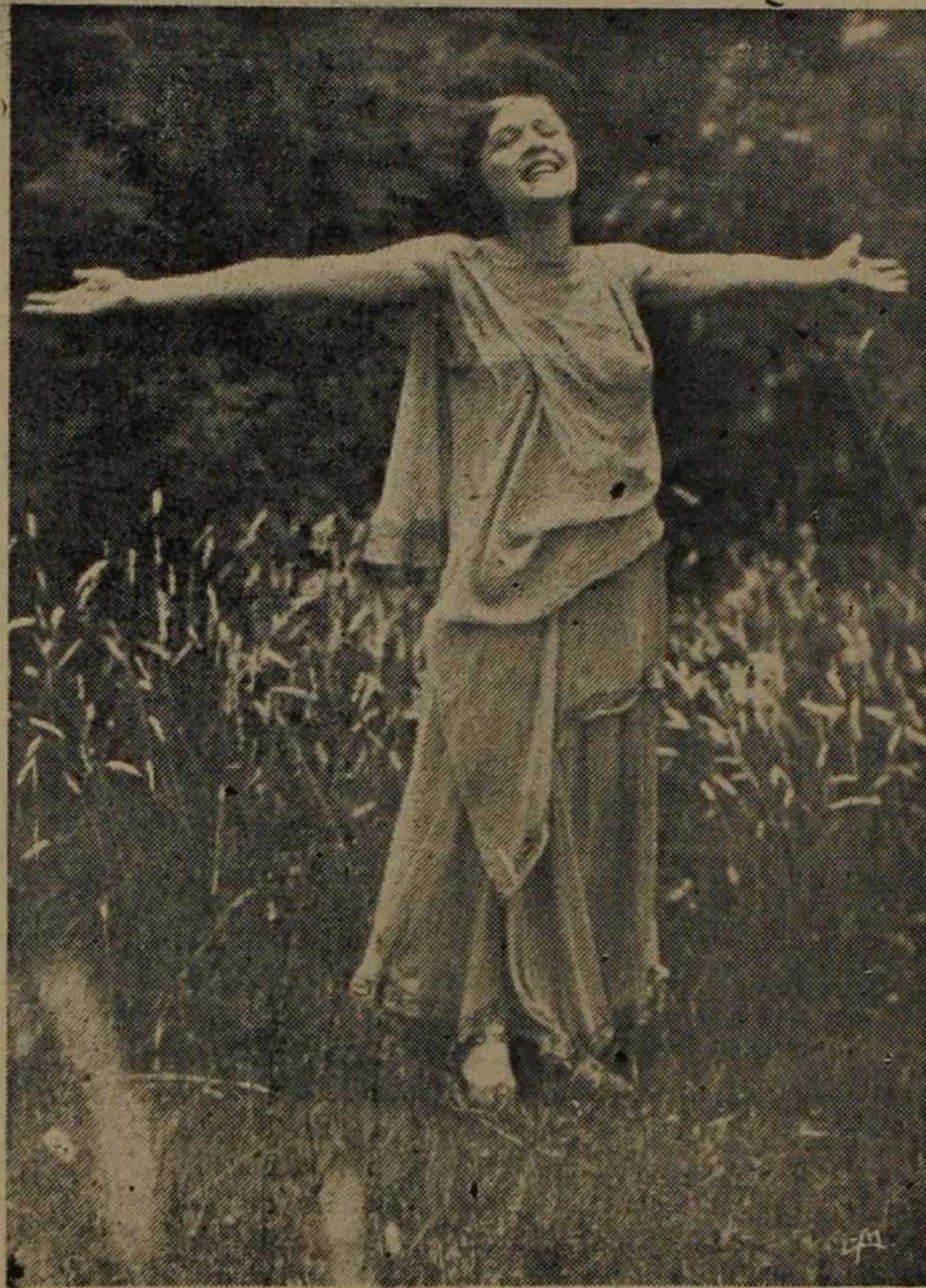
Berta Singerman en una de sus audiciones poéticas al aire libre. (En uno de los prados de Chapultepec, México, D. F.)

Una vez el autor de Cyrano dedicó a la divina Sarah un magistral soneto que comenzaba: «En este tiempo sin belleza tú