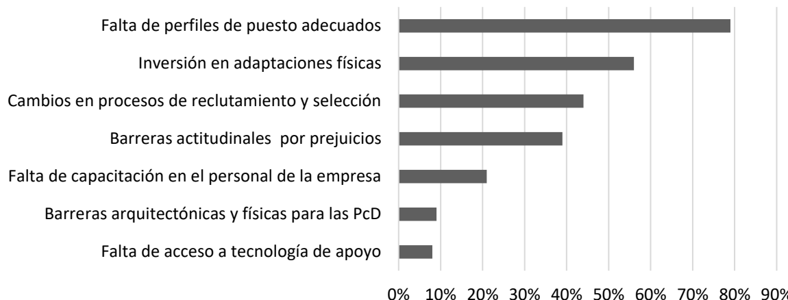
465 466 Figura 3. Empresas costarricenses encuestadas (retos para la inclusión laboral): percepción de retos 467 para la inclusión laboral de PcD (en porcentajes). Fuente: Elaboración propia sobre la base de 468 encuesta aplicada a 381 empresas costarricenses para conocer la percepción sobre los retos que 469 debe enfrentar una persona con discapacidad para ser incluida en el ámbito laboral, 2019.

470 Las personas entrevistadas coinciden en la importancia de las capacitaciones para el personal 471 en temas de inclusión y los cambios en procesos de reclutamiento y selección ya que estos 472 también aportarían a generación de los puestos adecuados. Además, indican que el reto más 473 importante es actitudinal; además, uno de los entrevistados agregó otro reto adicional: “el 474 transporte y acceso externo, como usuaria de silla de ruedas me influye la condición de las 475 calles con huecos, aceras sin rampas y entradas con gradas, falta semáforos, etc.” (Solano, 476 comunicación personal, 2018 ).