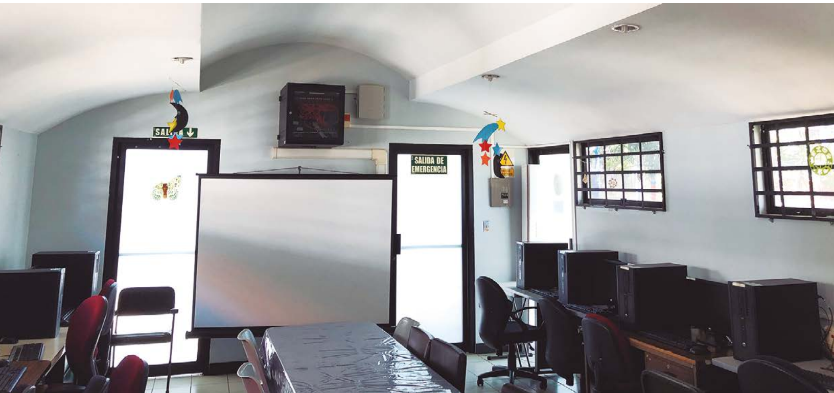
Figura 10. Vista interna del Laboratorio de cómputo y sala multiusos de la Biblioteca Infantil Miriam Álvarez Brenes

Experiencia de una autoevaluación que contribuyó a generar sinergias para el trabajo y el aprendizaje colaborativo en la Biblioteca Infantil Miriam Álvarez Brenes