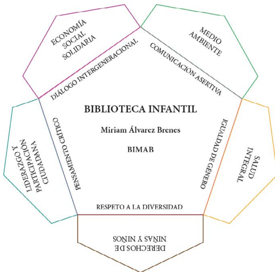
Figura 7. Ejes temáticos y transversales de la Biblioteca Infantil Miriam Álvarez Brenes. Elaboración propia.