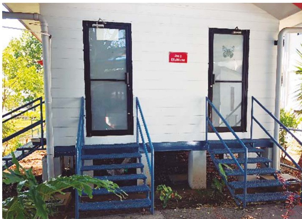
Figura 9. Vista externa del Laboratorio de cómputo y sala multiusos de la Biblioteca Infantil Miriam Álvarez Brenes

La dinámica para la realización del FODA se complementó con dos sesiones presenciales llevadas a cabo en el laboratorio de la Biblioteca Infantil (ver figura 9 y 10), los días 6 y 20 de mayo del 2019 respectivamente.