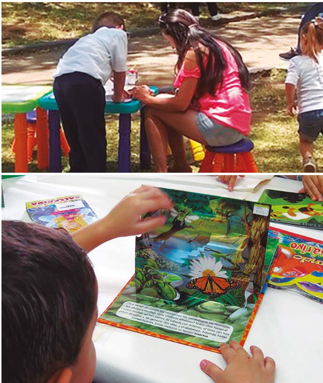
Figura 4. Santo Domingo de Heredia, actividades del Plan piloto de la modalidad itinerante de la Biblioteca Infantil Miriam Álvarez Brenes.

Experiencia de una autoevaluación que contribuyó a generar sinergias para el trabajo y el aprendizaje colaborativo en la Biblioteca Infantil Miriam Álvarez Brenes