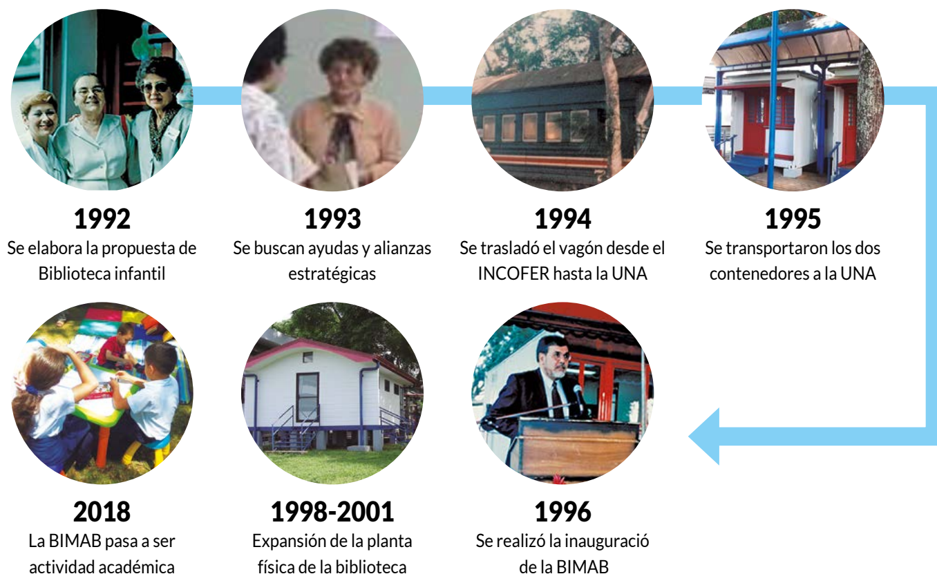
Figura 5. Cronología histórica de la Biblioteca Infantil Miriam Álvarez Brenes Nota: Elaboración propia.

Observemos enseguida en este punto, una línea del tiempo (ver figura 5) que resume el camino recorrido por la Biblioteca Infantil Miriam Álvarez Brenes, de 1992 al 2018: