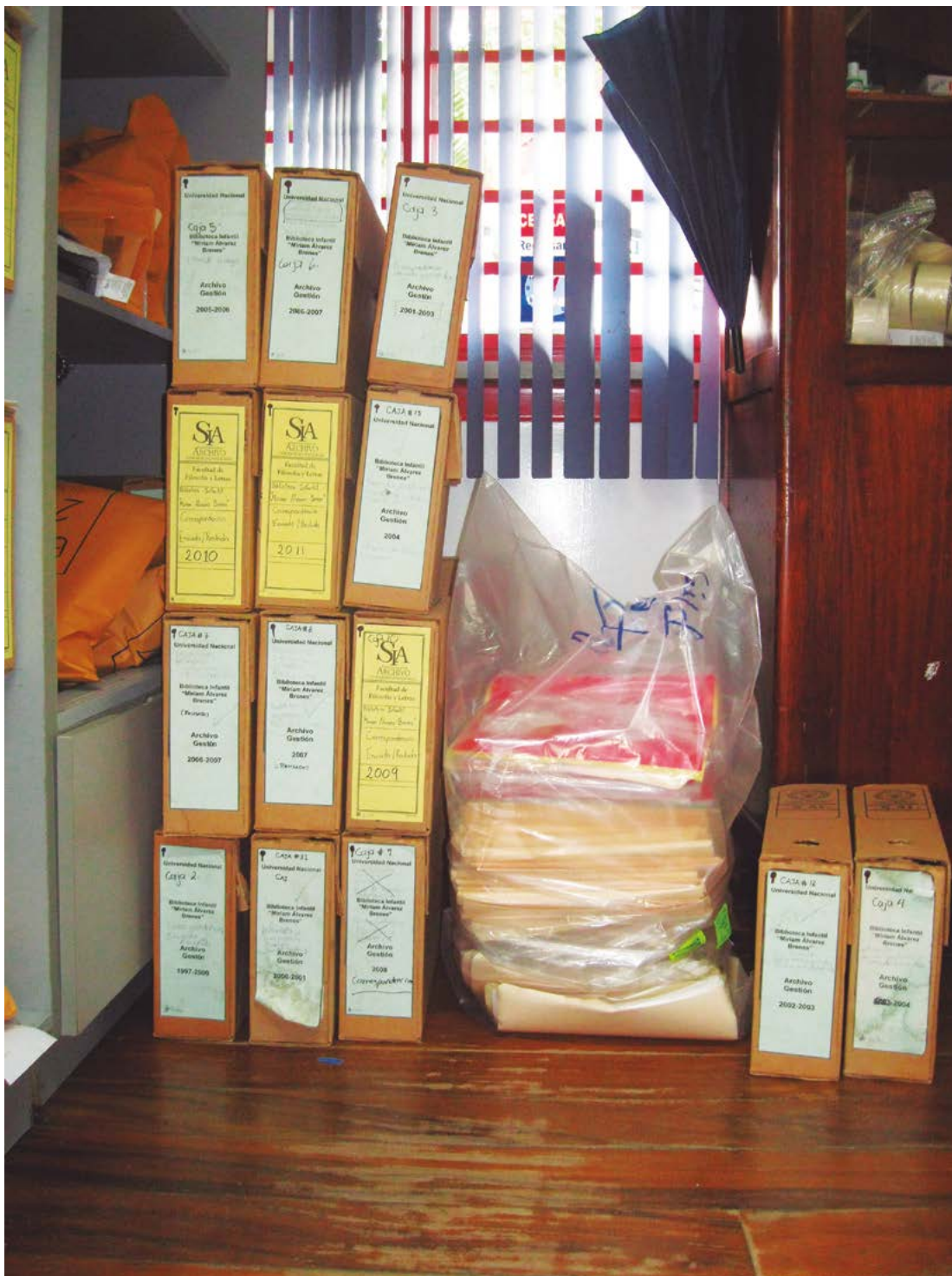
Figura 6. Documentos del archivo de la Biblioteca Infantil Miriam Álvarez Brenes apilados a inicios del 2018

Experiencia de una autoevaluación que contribuyó a generar sinergias para el trabajo y el aprendizaje colaborativo en la Biblioteca Infantil Miriam Álvarez Brenes