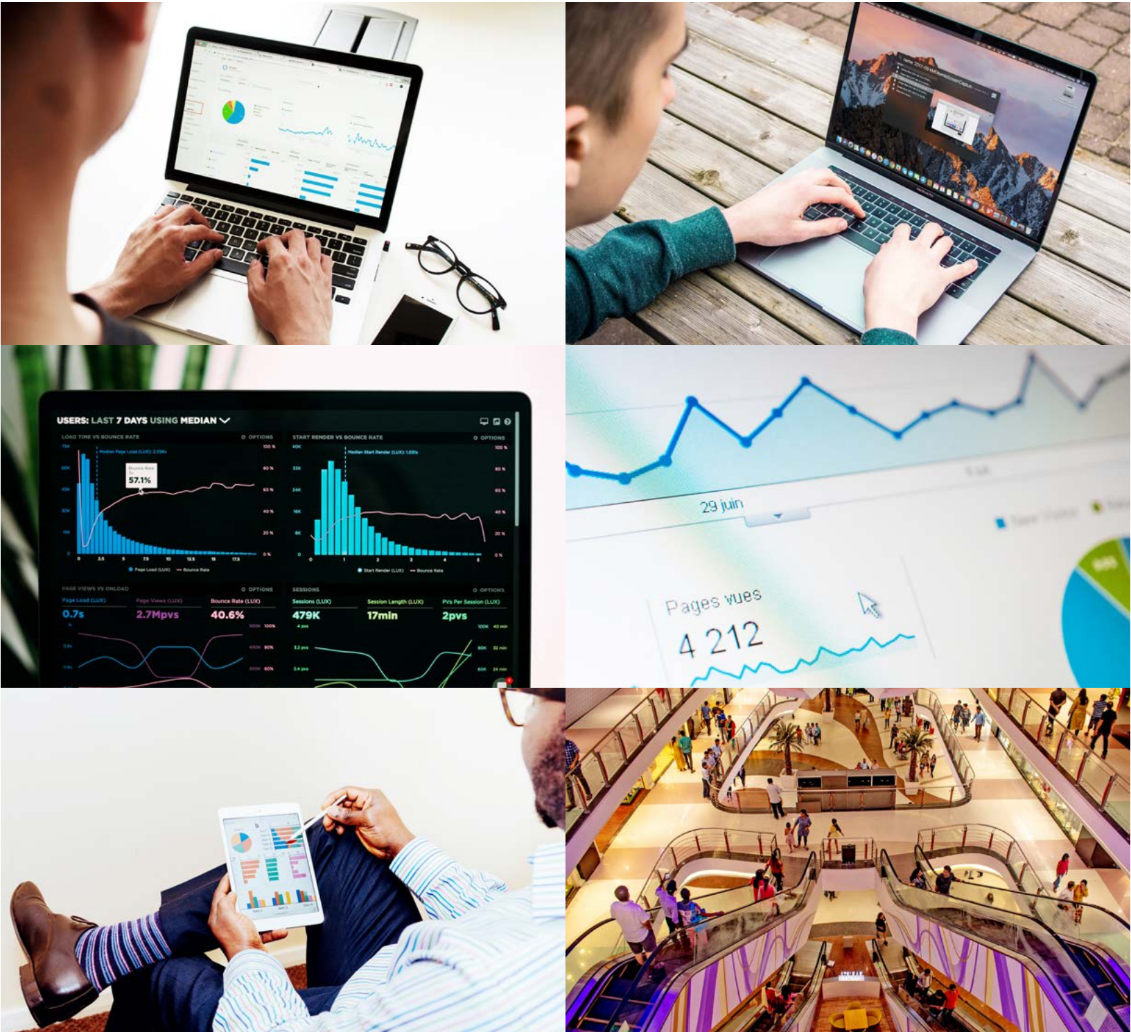
Figura 15. Recursos tecnológicos para la tabulación y análisis de datos

Experiencia de una autoevaluación que contribuyó a generar sinergias para el trabajo y el aprendizaje colaborativo en la Biblioteca Infantil Miriam Álvarez Brenes