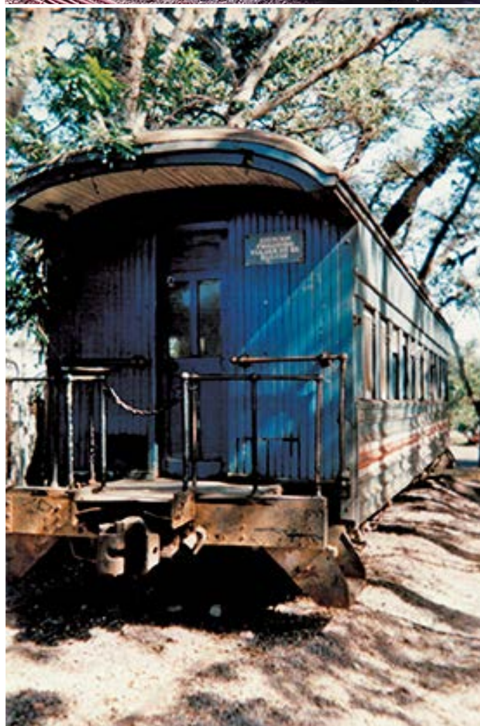
Figura 2. Restauración del vagón donado por el INCOFER y trasladado a la UNA en octubre de 1994