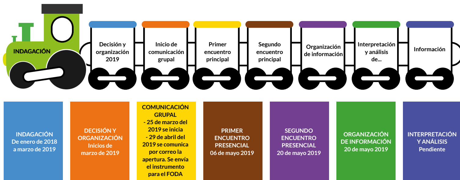
Figura 14. Hitos (momentos) de la experiencia Nota: Elaboración propia.

De manera resumida, incluimos a continuación la figura 14 sobre lo que consideramos fueron los hitos fundamentales de la experiencia que hemos sistematizado: