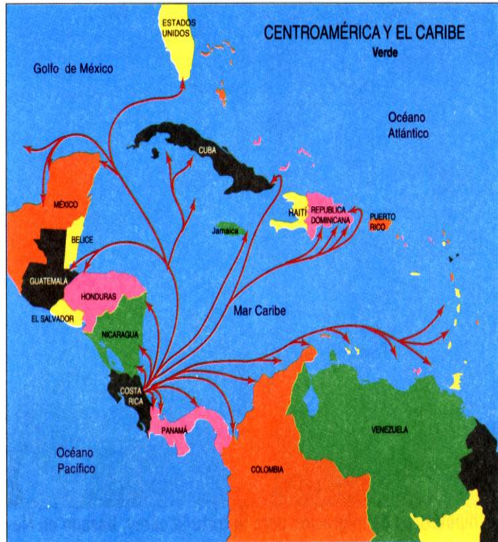
Figura 2. Rutas hipotéticas de migración para la tortuga verde (Carr et al., 1990).