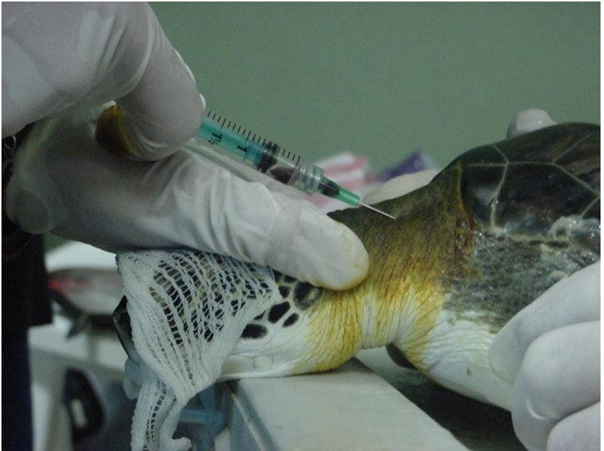
Figura 5. Fotografía de la técnica empleada para el sangrado.