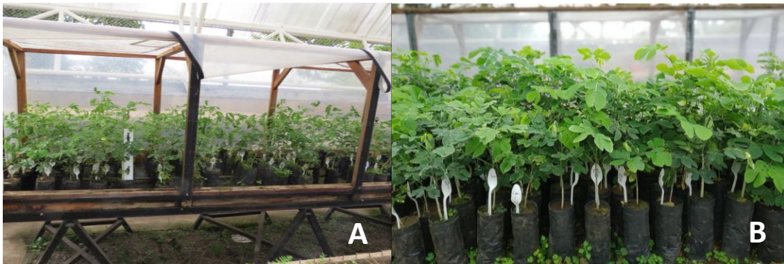
Figura 1. Plantas mantenidas en un invernadero micro túnel (A) y plantas mantenidas fuera del invernadero micro túnel (B).

Posteriormente, basado en los resultados del primer ensayo, las plantas madre se trasladaron a un espacio dentro del invernadero, pero fuera del invernadero micro túnel para un segundo ensayo se emplearon los tratamientos de desinfección D5 y D6. Con un régimen de riegos de un minuto tres veces por día, y aplicando Kasugamicida 5 ml/l (fungicida y bactericida) dos veces por semana (Figura 1B).