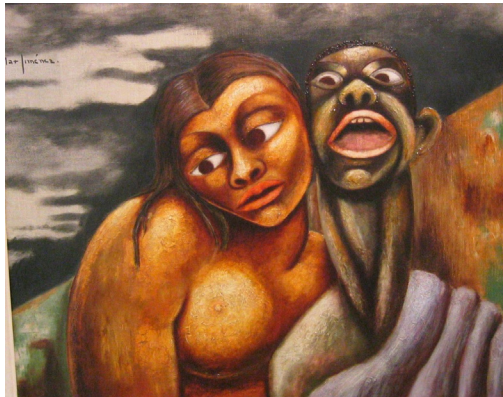
Imagen 4. Desesperanza (Max Jiménez, circa 1944)