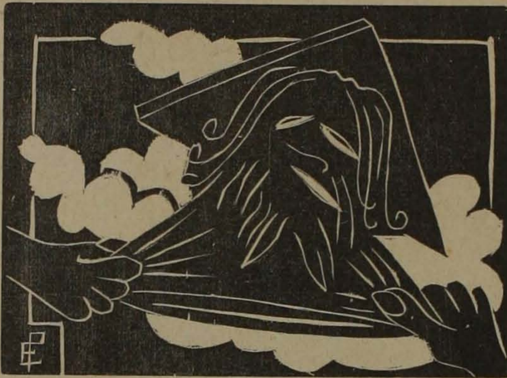
Un Dios de hule

= Envío del autor. Bogotá. Mayo de 1936. =