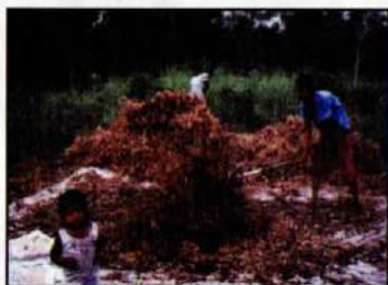
Soplado de frijol