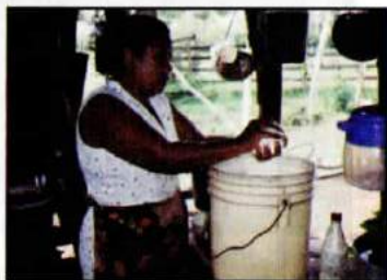
Elaboración de cuajada