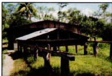
Secadoras de cacao y otros granos