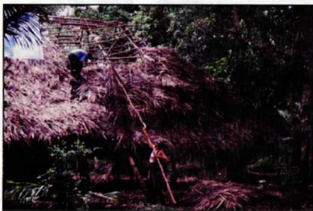
Construcción tradicional de techos de palma