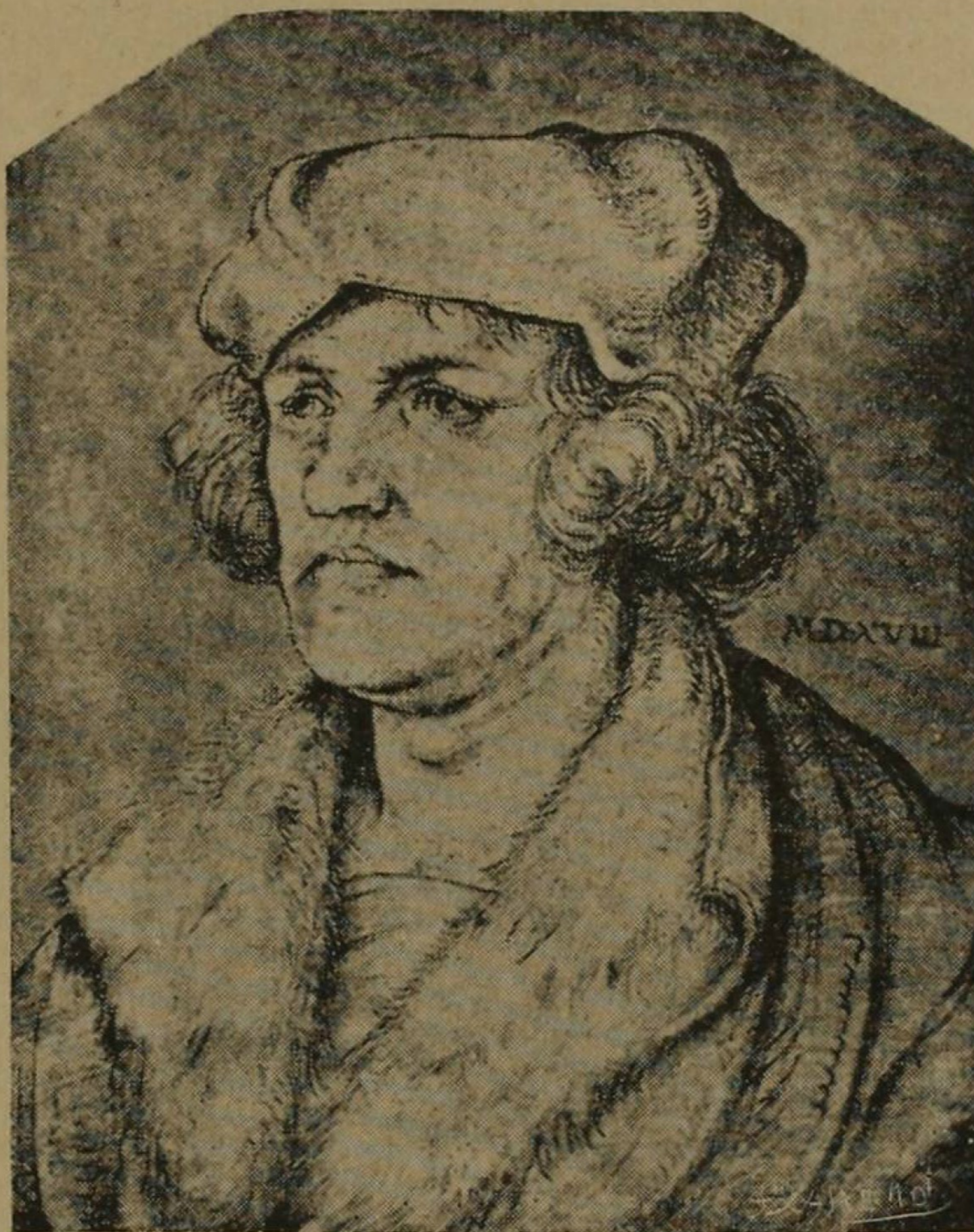
Retrato de un desconocido

La profunda fe cristiana y el pesimismo del maestro de la La vida de la virgen , de la Pasión y del Apocalipsis , no estaban de acuerdo con el Renacimiento pagano y sus interpretaciones religiosas. Su tremendo