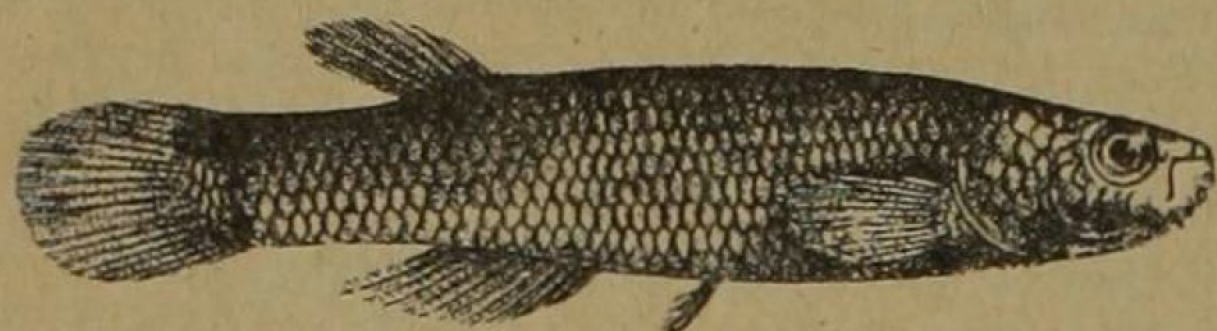
Rivulus isthmensis , Garman, en tamaño natural

Los Rívilus son peces tan pequeños que apenas llegan a siete centímetros de largo en su mayor tamaño; tienen la cabeza ancha, el cuerpo cilíndrico al centro y comprimido posteriormente; las reducidas escamas se cuentan en número de 42 sobre la línea longitudinal del costado, desde el opérculo hasta el nacimiento de la cola, que es ancha, circular y extendida verticalmente, en forma de abanico. Tienen una aleta dorsal angosta cerca de la cola y otra anal extendida, con doce radios, esta última; las pectorales son anchas y bajas, las ventrales pequeñas. Por su color de canela, profusamente manchado de sepia, semeja una trucha diminuta; con frecuencia presenta una mancha negra redonda, con bordes amarillos, en la base superior de la cola. El cuerpo es largo, arqueado hacia abajo, ligeramente plano en la parte superior; cuando están en reposo, descansan sobre las algas o raíces de lirios acuáticos, inmóviles, como si no respirasen siquiera; en cambio, cuando nadan, lo hacen con rapidez, como los barbudos, y se deslizan sobre el lodo en los pantanos con mucha agilidad. En un charco pequeño, cubierto de algas y yerbas acuáticas, sobre fondo lodoso, había más de cincuenta Rívilus, cerca de Taras, a 1480 metros de altitud; con frecuencia permanecen largo rato con la cabeza metida en el lodo, dejando afuera solamente la mitad posterior del cuerpo. Son peces ovíparos que hacen su desove en las aguas estancadas.