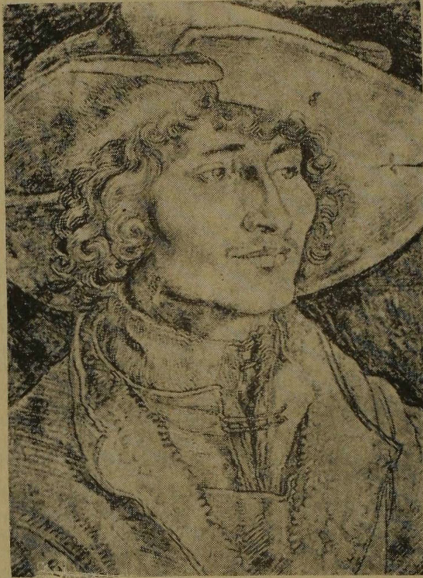
Retrato de Lucas Van Leyden