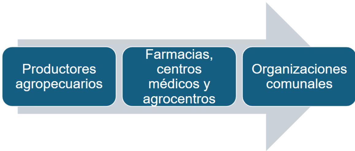
Figura 2. Actores sociales meta de la subcuenca del río Peñas Blancas.