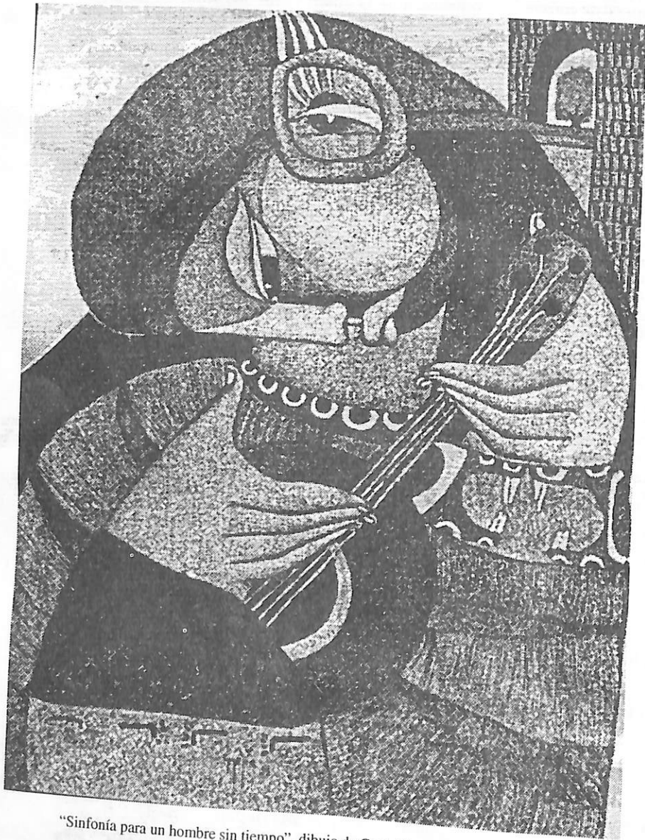
"Sinfonía para un hombre sin tiempo", dibujo de Carlo Mejía, pintor salvadoreño.