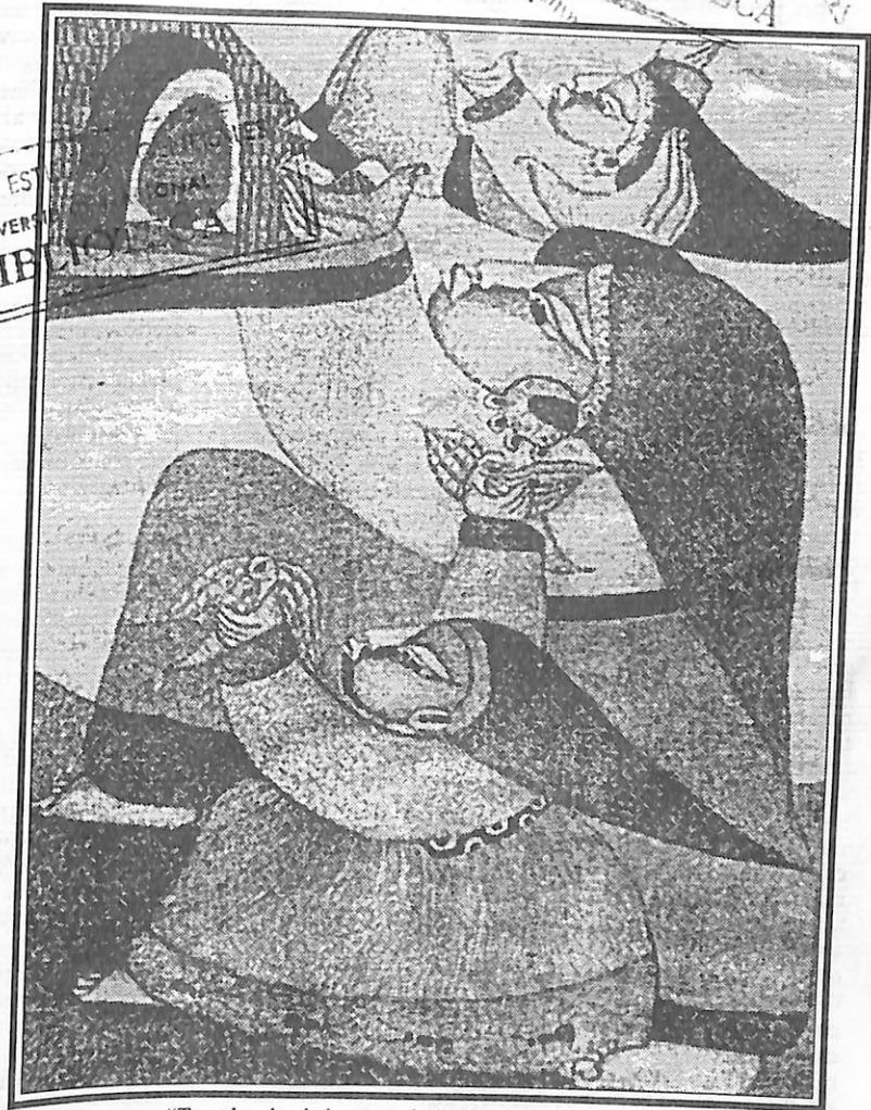
"Templos de piedras pesadas", dibujo de Carlo Mejía.