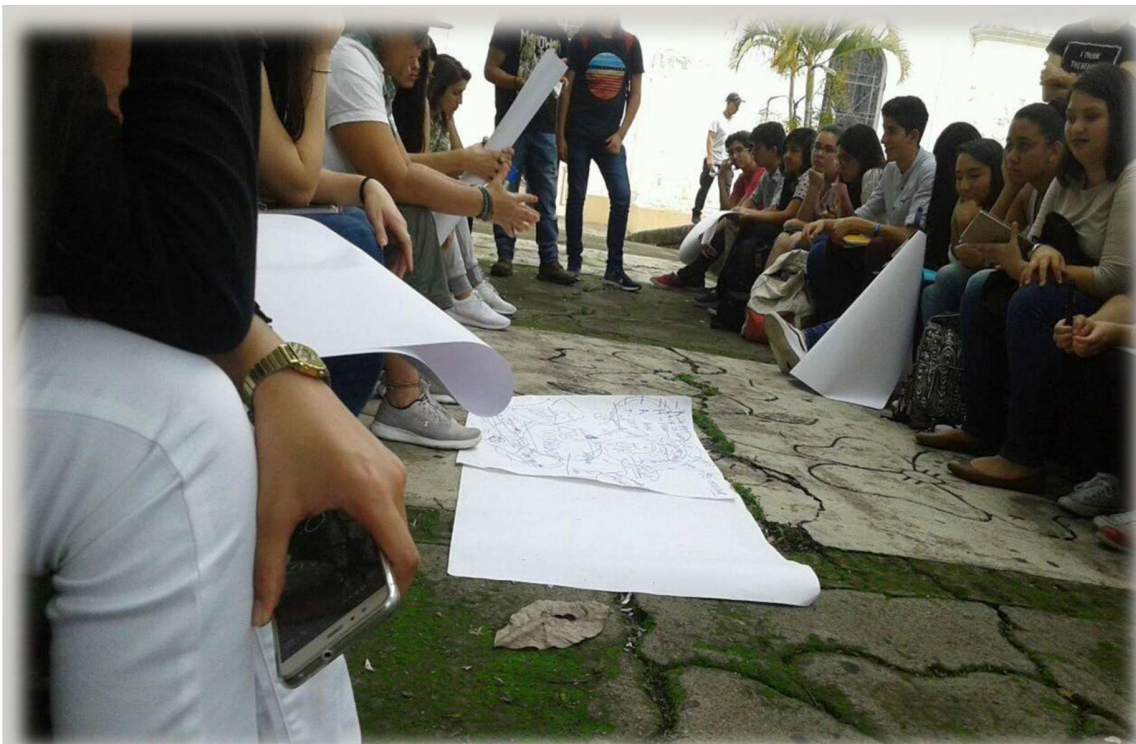
Imagen: Pueblo de Garabito. Diagnóstico y Acción Comunitaria. RED DESC ARUANDA/2019. BASE DE DATOS