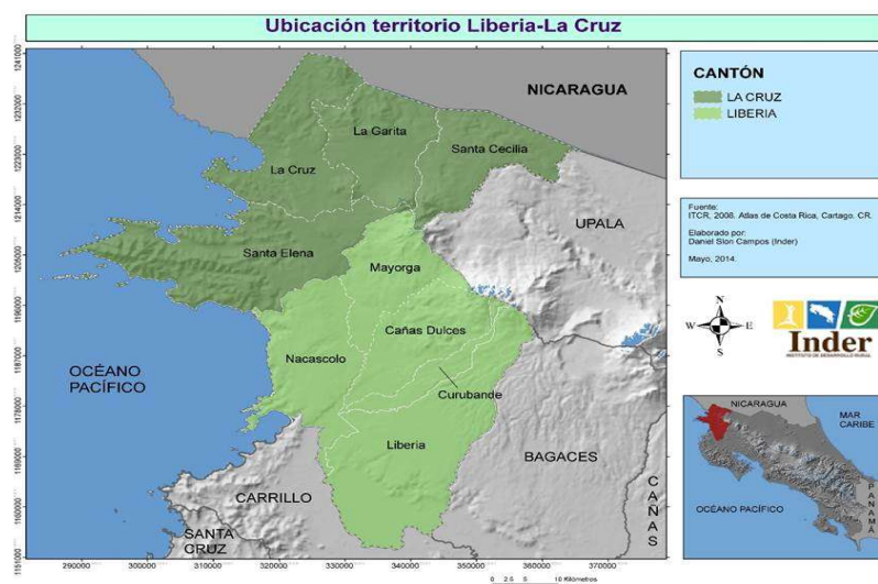
Mapa de zona norte Guanacaste, Cantón La Cruz, distrito La Cruz