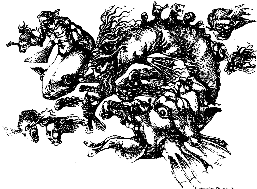
Ilustración: Osvaldo Triana