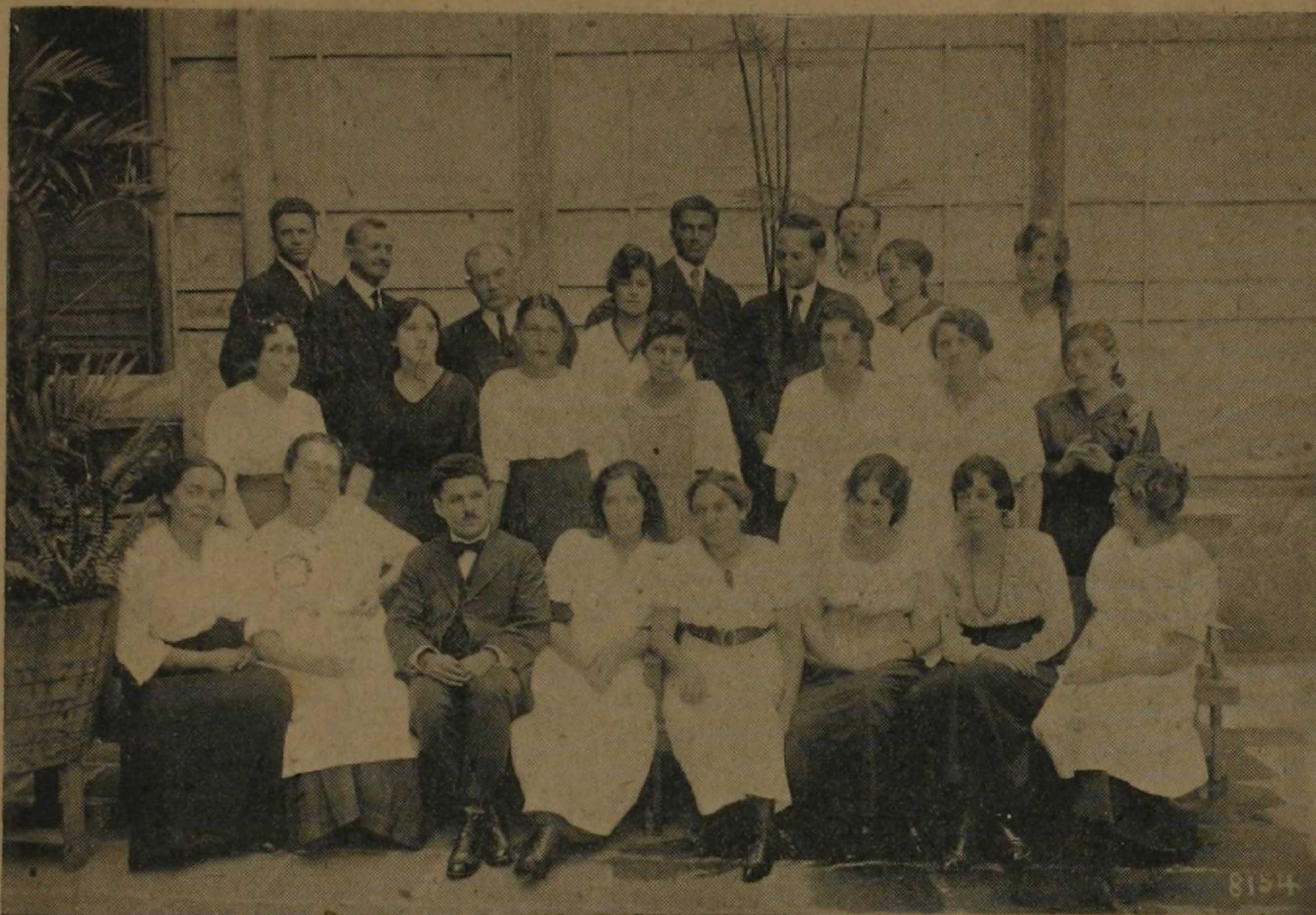
EL GRUPO DE MAESTROS DE SAN JOSÉ QUE ORGANIZÓ Y ADMINISTRÓ EL HOSPITAL DE EMERGENCIA DE QUE SE HABLA EN ESTE INFORME

mejor, más culta, más próspera y más bella. Con lo que se explica el empeño inquebrantable del Gobierno del señor AGUILAR BARQUERO por abrir todas las escuelas primarias que el mando anterior cerró, en los campos sobre todo. Este dato al respecto es revelador: del mes de setiembre del año pasado a la fecha, se han abierto 24 escuelas, sin contar el establecimiento de nuevos grados y secciones en las ya existentes, lo que implica abrir las puertas del conocimiento y del estudio a más de 3000 alumnos, aproximadamente.