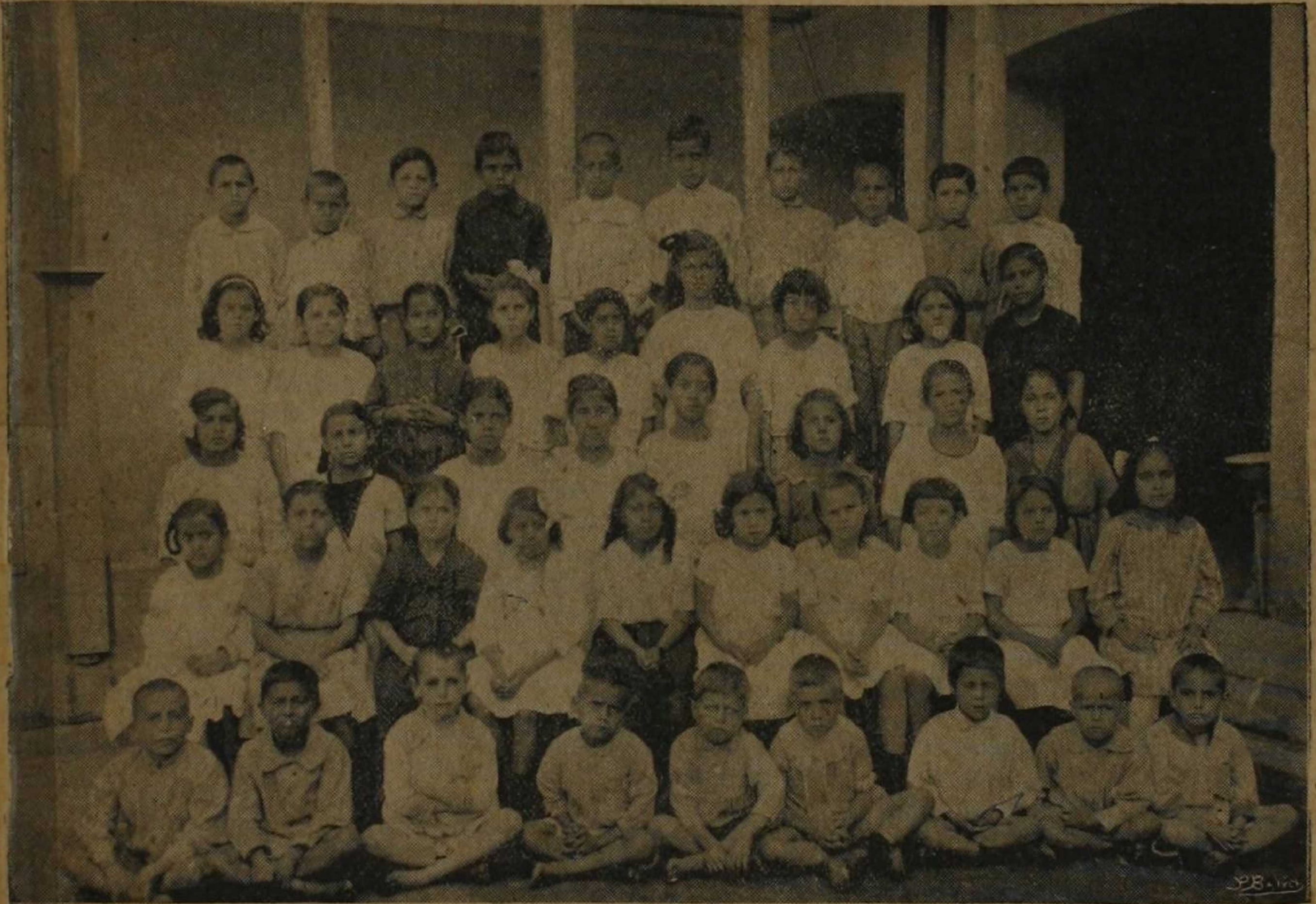
LA PRIMERA COLONIA ESCOLAR DE VACACIONES ORGANIZADA EN COSTA RICA (Enero de 1920)