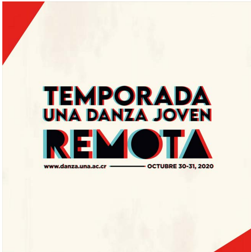
Figura 1. Imagen gráfica del afiche de II Temporada Remota de UNA Danza Joven

Nota: Diseño Gráfico de Soledad Morales (2020). Imagen de archivo gráfico del proyecto UNADJ (2020).