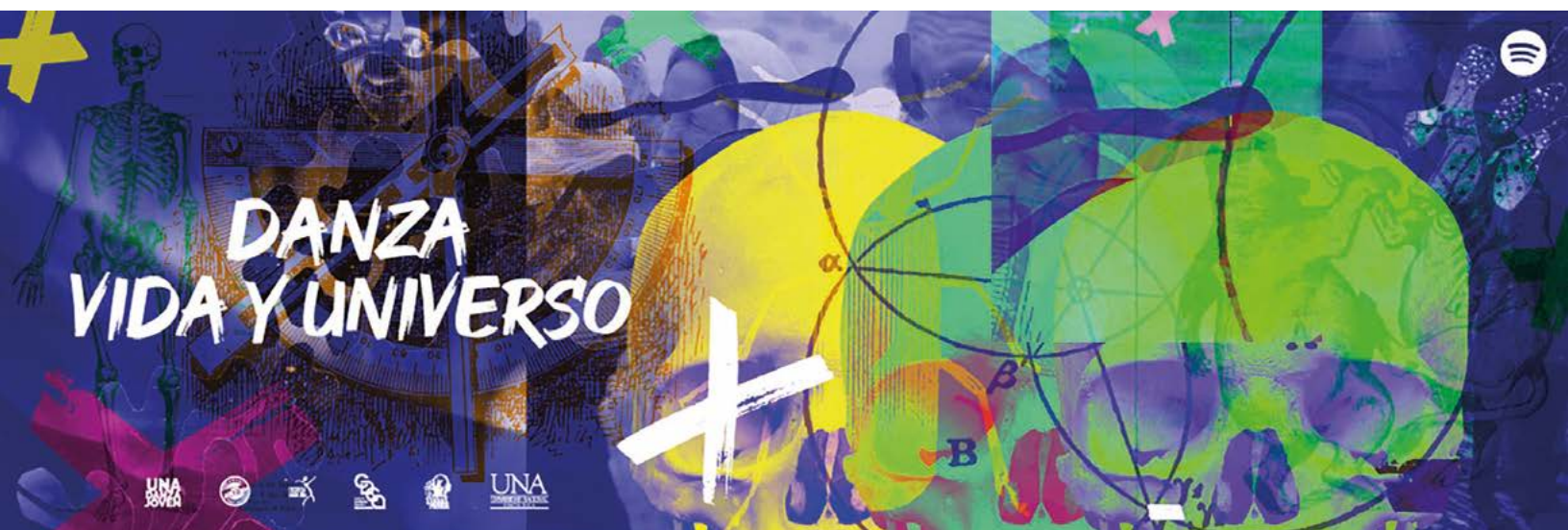
Figura 3. Imagen gráfica del programa de podcast Danza, Vida, Universo Big Bang de UNA Danza Joven

Nota: Diseño Gráfico de Soledad Morales (2020). Imagen de archivo gráfico del proyecto UNADJ (2020).