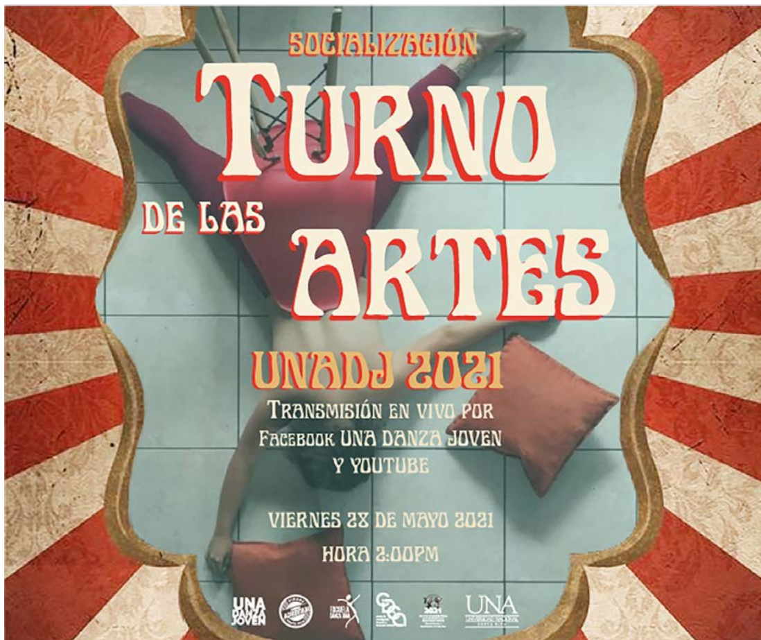
Figura 4. Afiche Temporada 2021

Nota: Diseño de Wensi Fuentes H. Imagen del archivo del proyecto UNA Danza Joven.