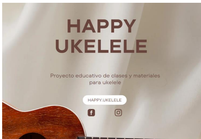
Figura E 2. Imagen del sitio web 1.

En la Figura E2 se encuentra la portada de la página web del proyecto educativo Happy Ukelele.