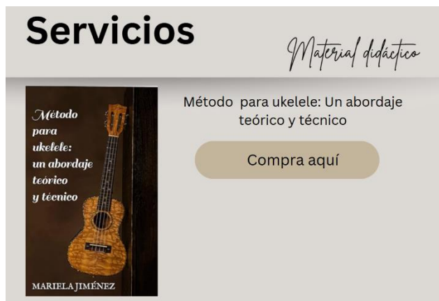
Figura E 3. Imagen del sitio web 2.

En la Figura E3 se halla una presentación del sitio web.