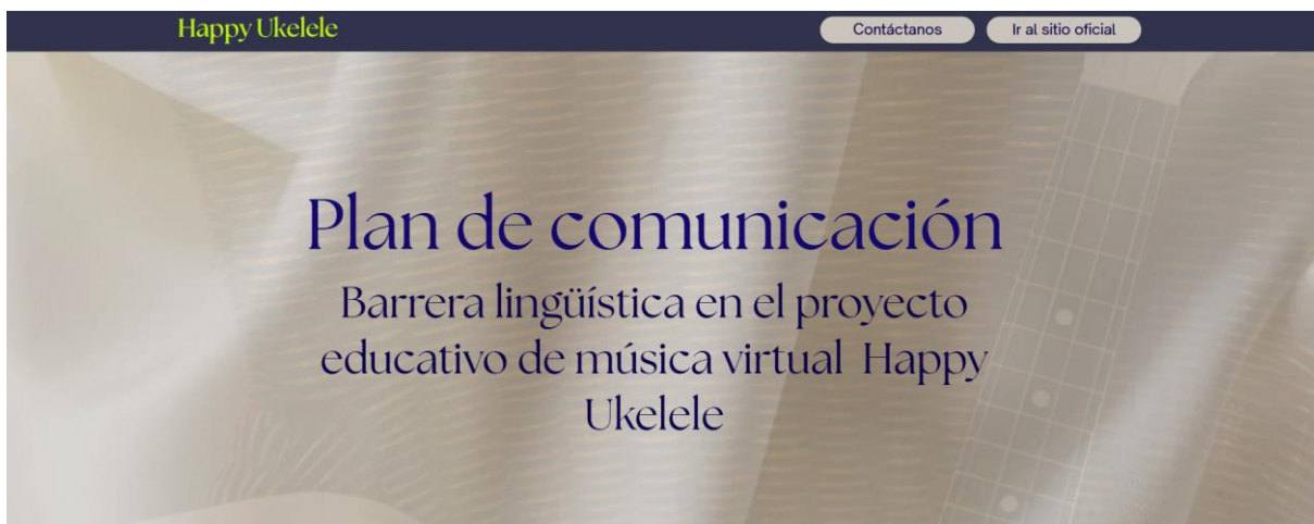
Figura G 1. Imagen del sitio web del plan de comunicación.

Nota: Imagen del archivo de la investigación.