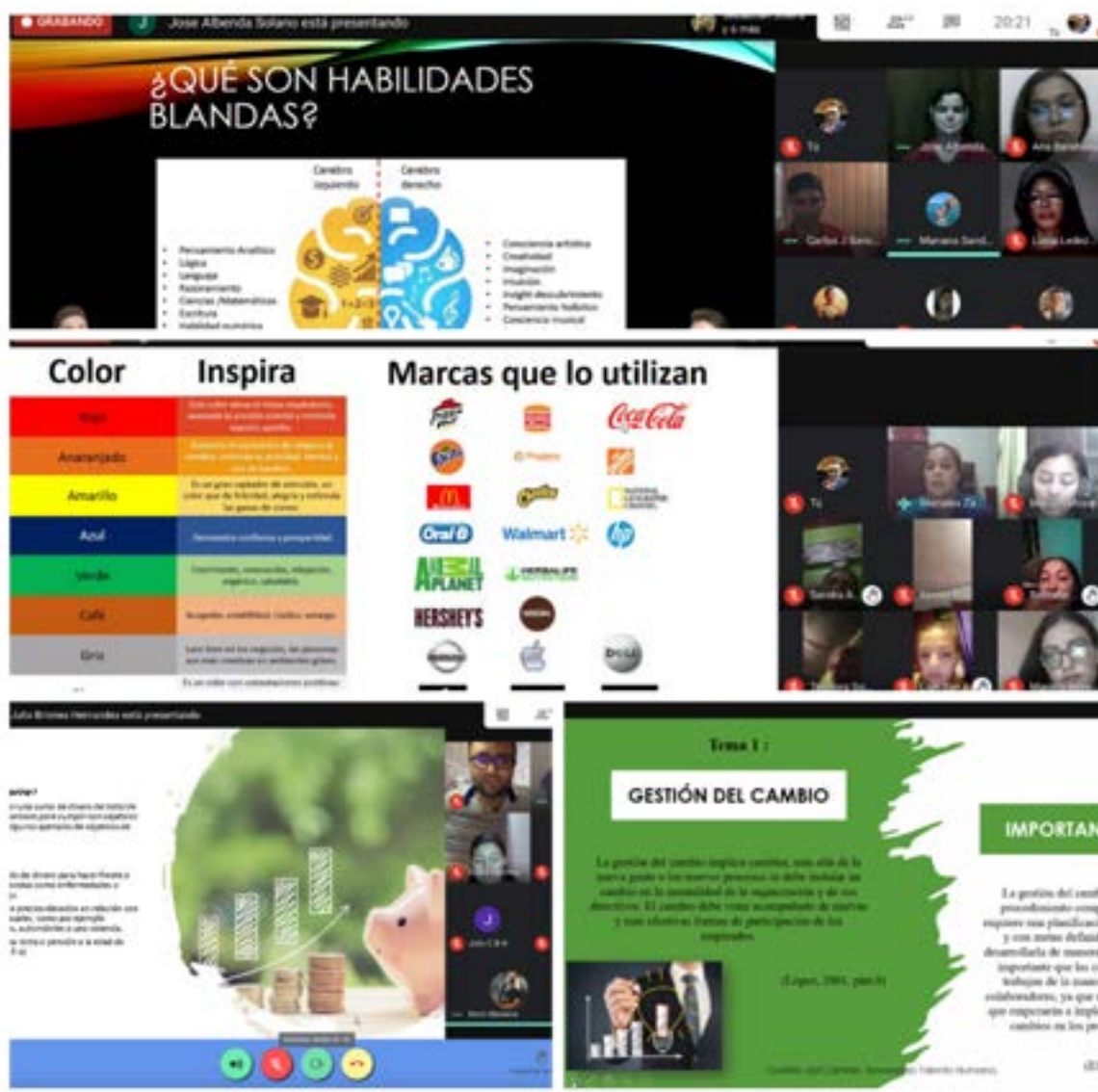
Evidencias de webinars impartidos

Nota. La Figura 3 muestra evidencias de los webinars impartidos al grupo de emprendedores año 2021.