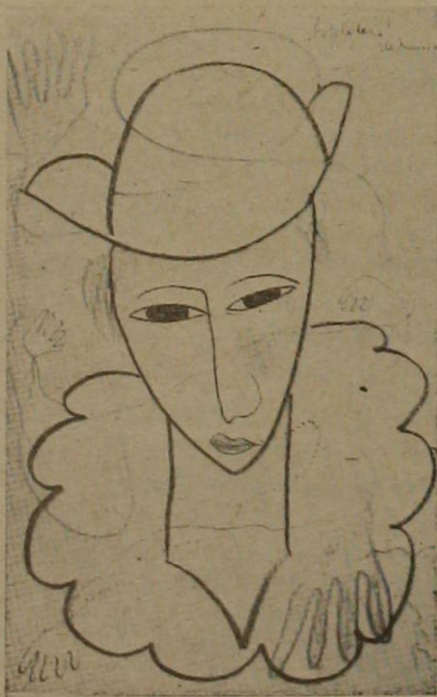
El joven que no dió a tiempo las bofetadas

Guardo entre mis libros un ejemplar de las Canciones de Federico como una prenda invalorable. El libro es el recuerdo de una tarde de fraternal camaradería. Federico llegó a mi casa en las horas del mediodía; salió muy entrada la noche. Mientras hablábamos de todo y de todos, dibujaba con lápices de colores las páginas de su libro. Quiero que veas, me decía, que soy mucho mejor pintor que poeta. Pensó primero dejar en sus Canciones algunos rasgos sugestivos; pero fué animándose en la tarea y dejó al fin, escoltando sus poemas, estampas primorosas. Debajo de la dedicatoria cordialísima escribió: "con cuatro dibujos y dos más". Lindos son los dibujos, tocados de su dueño inseparable. No los he visto mejores de su mano. Bien se ve que no fué la pintura su violín de Ingres sino el costado gráfico de su gracia lírica; la atusión irónica de su propia fuerza creadora. Al entregarme el libro, Federico me explicó un poco sus dibujos; y cada explicación valía los trazos y les añadía historia y poesía: eran las frutas alegres de sus campos inventados, la señorita romántica transitando por la alameda a media luz con una sola palabra en los labios: amor; la muchacha andaluza