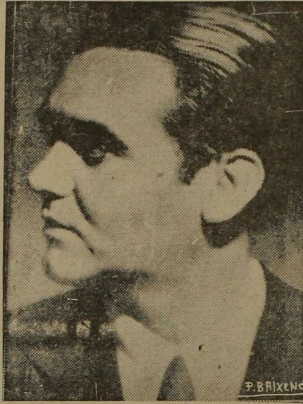
Federico García Lorca

En otra parte he dicho cómo la estancia habanera de Federico García Lorca fué el más gozoso deslumbramiento. Había muchas razones para ello. Federico estaba en un instante hermoso. go-