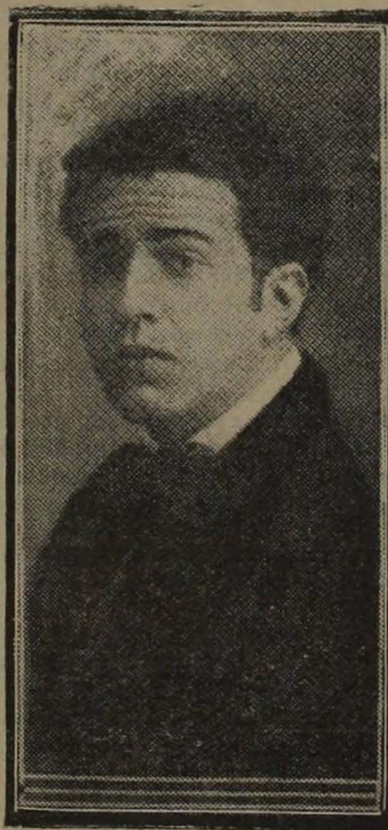
JAIME TORRES BODET

Agrada también, en todo el libro, ese afán discreto de depuración, sin que por esto se quite espontaneidad y ligereza al estilo. El señor Torres Bo-