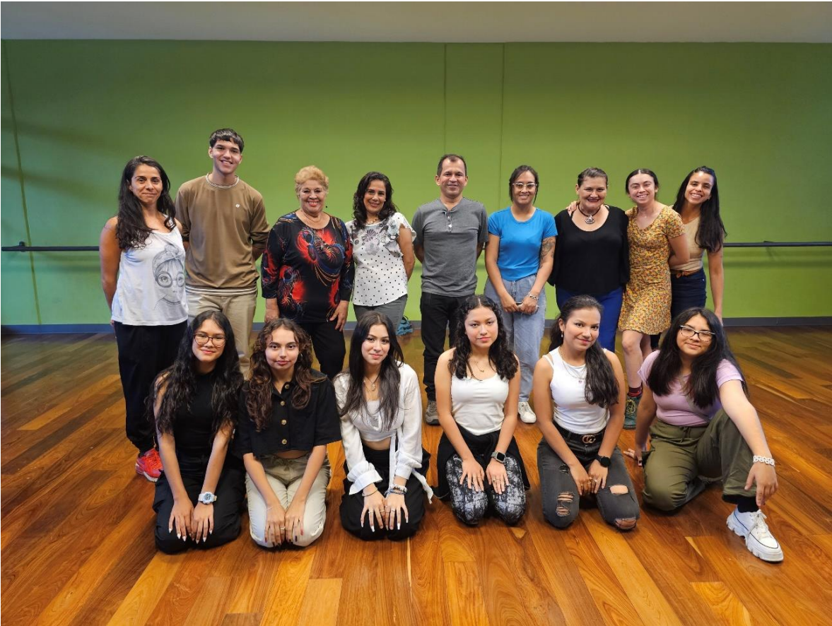
Imagen 1. Facilitadora, grupo de participantes y familias del CCP de Cartago. 09 de enero de 2024.