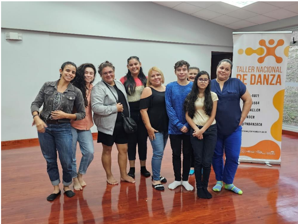
Imagen 5. Facilitadora, participantes y familias del CCP de Desamparados.

18 de diciembre de 2023.