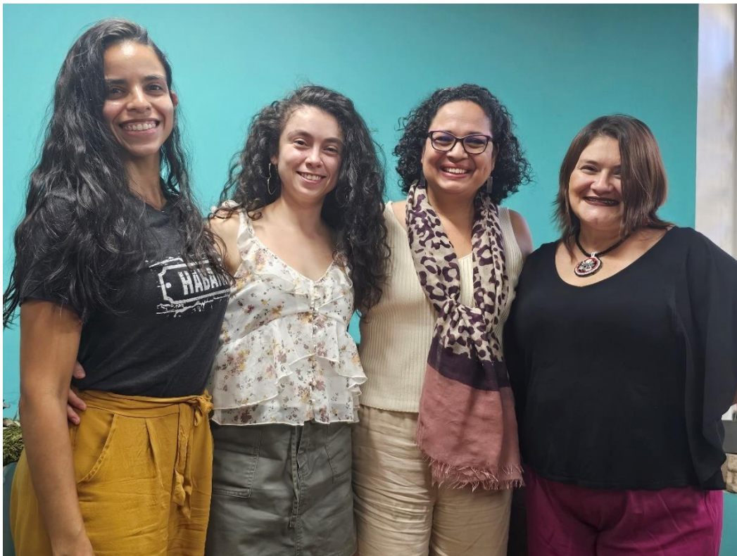
Imagen 3. Viceministra de Cultura, Sra. Vera Vargas. Ministerio de Cultura y Juventud. 12 de diciembre de 2023.

las dimensiones de la vida de cada persona participante, trascendiendo el espacio del taller de danza que se desarrolla en cada CCP.