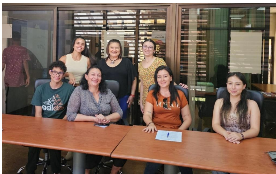
Imagen 6. Participantes y familiares del CCP de Heredia. 09 de enero de 2024.

El primer formador de Santa Cruz y de Desamparados que, en la actualidad, trabaja solo en Sede Central del TND, ofertaba la técnica de danza contemporánea, según las edades (niñez, adolescencia o jóvenes), pero en la primera sesión de cada taller realizaba lo que llamó un círculo de diálogo reflexivo para reconocer los intereses y necesidades de las personas participantes, lo que le permitía tener un diagnóstico inicial de temáticas, las cuales integraba a las clases de técnica y al proceso de creación coreográfica, siempre consensuando con las personas jóvenes el enfoque y el alcance de cada sesión.