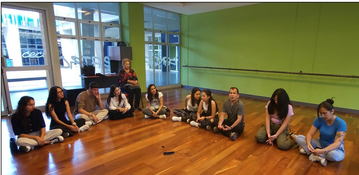
Imagen 10. Imagen extraída de la entrevista grupal con participantes y familias del CCP Cartgo.

Filmación: Fraisa Alvarado Calvo para la OEI. 09 de enero de 2024.