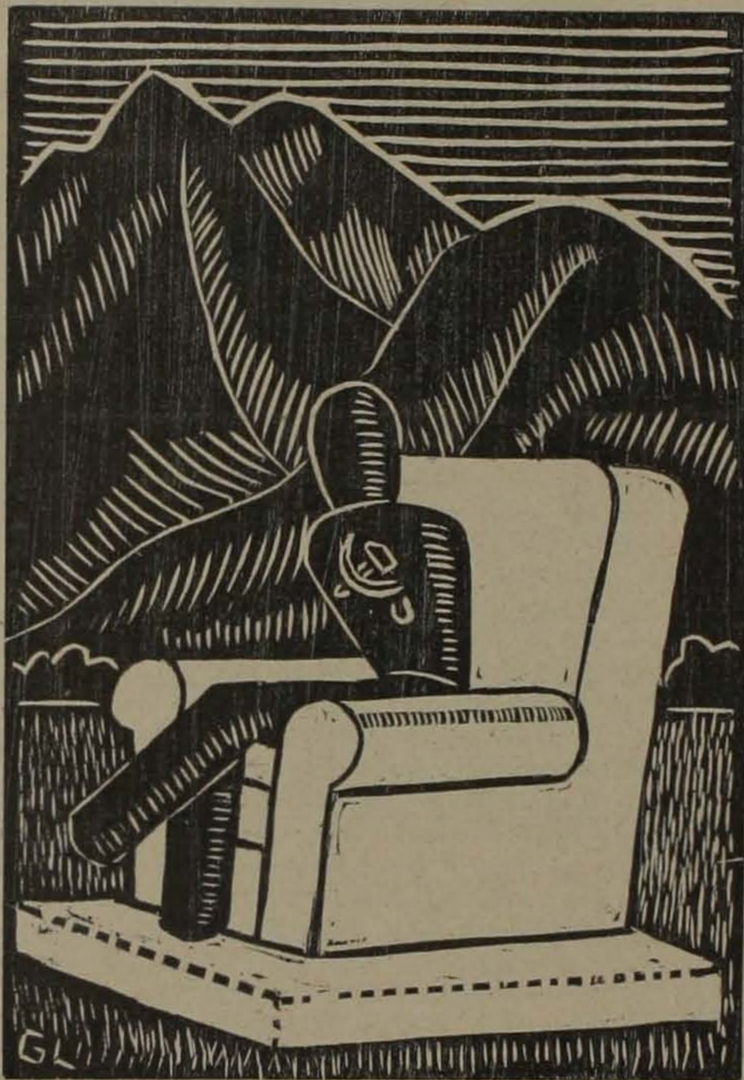
(Madera de Laporte) Su vida se desenvuelve con la monotonía de un bienestar burgués.—Alberti.

La relación del hombre a estos tres mundos es constante durante su vida física. Vive en el mundo físico en sus actividades corporales, — pensando deseando y actuando—por medio del cerebro y sistema nervioso, al tiempo que cumple con