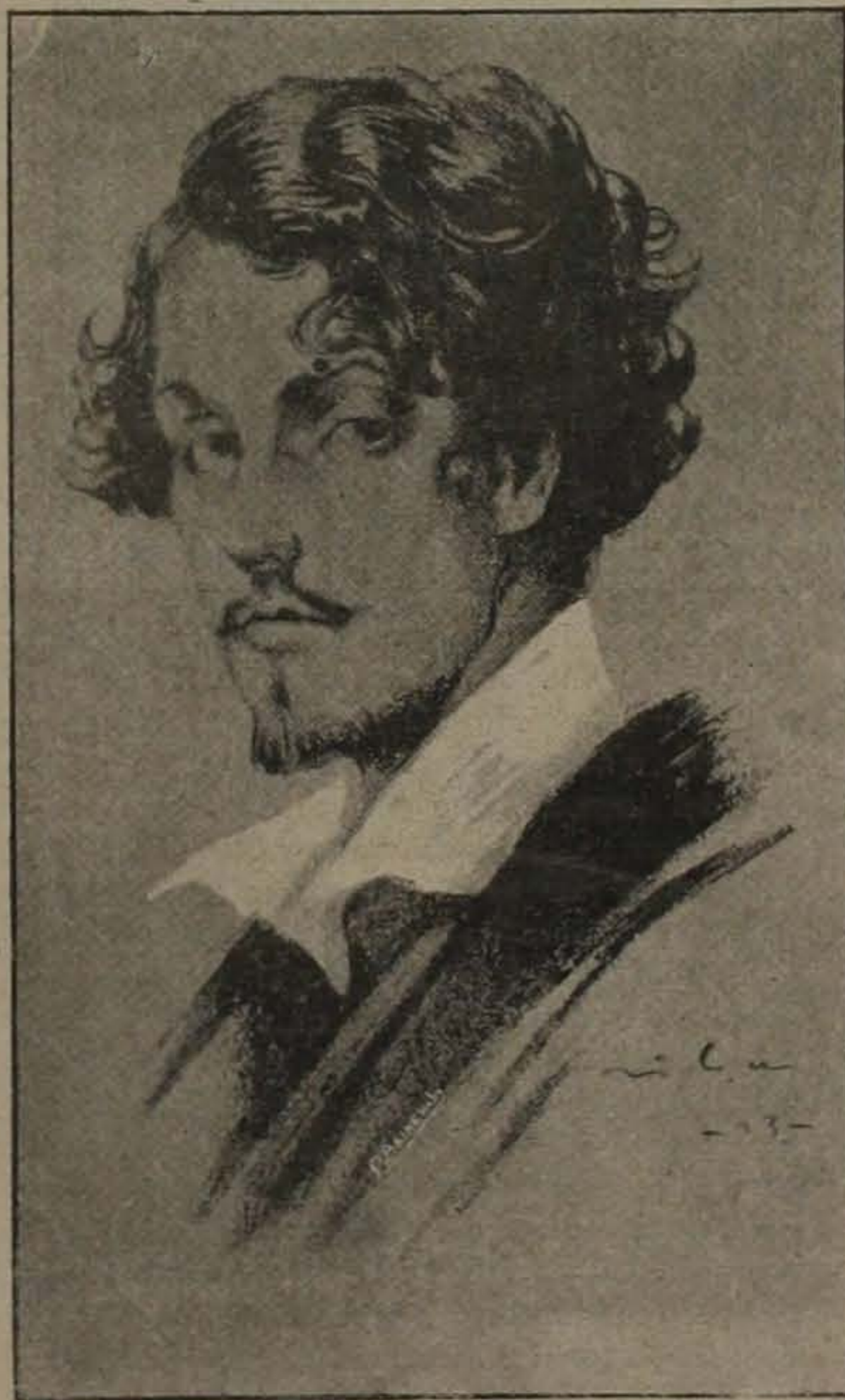
Gustavo Adolfo Bécquer

Ha poco aquí en la Habana, se le hizo un gran festival a Lope de Vega, en conmemoración a que cumplía años en números redondos de haberse muerto. Todavía me pregunto por qué se le hace homenajes a Lope de Vega, y creo haber encontrado la solución: la cantidad puede llegar a tener visos de calidad, algo así como las pirámides, a las cuales no se les puede negar caracteres de calidad. Lope