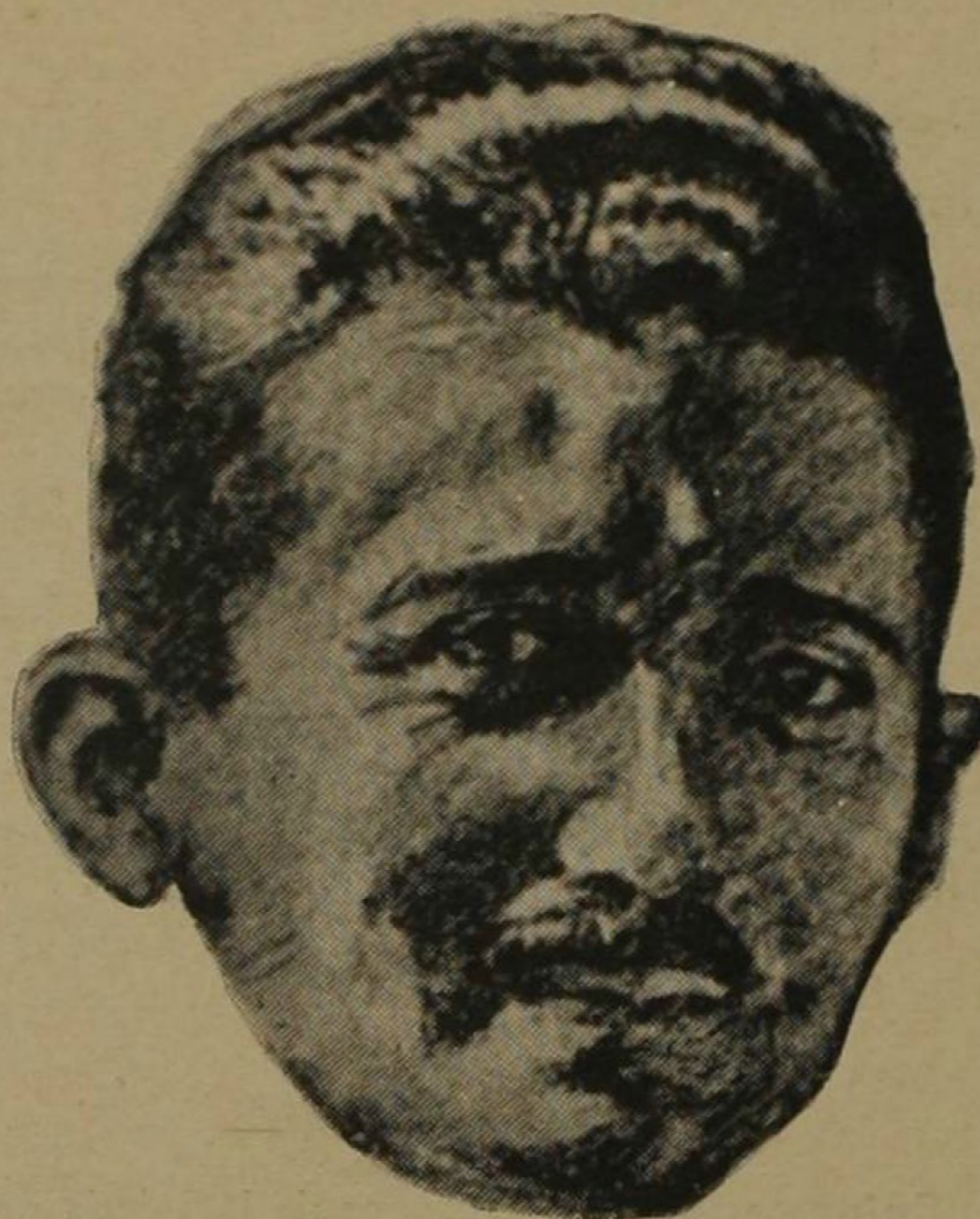
E. Roig de Leuchsenring

Predica Martí, reiteradamente, siguiendo así una gloriosa tradición antillana de la que fueron heraldos, entre otros puertorriqueños ilustres, Betances y Hostos —y un dominicano esclarecido, Máximo Gómez— la unión cul-