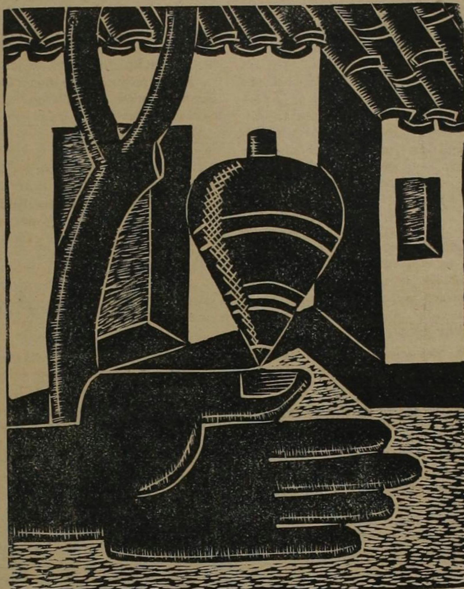
Báileme este trompo en la uña