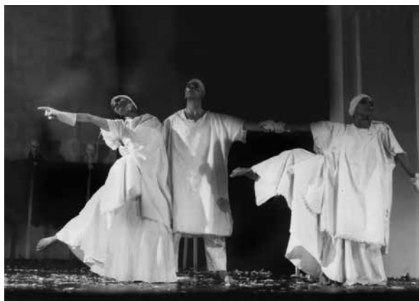
Gritos escondidos. Coreografía: Rogelio López. 1987. Teatro Connout. Lima, Perú.