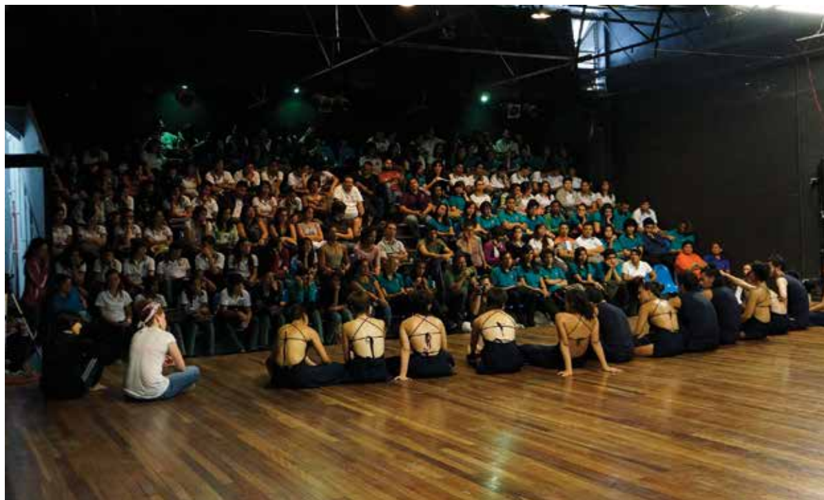
Danza a la carta. 2013. Teatro Montes de Oca.