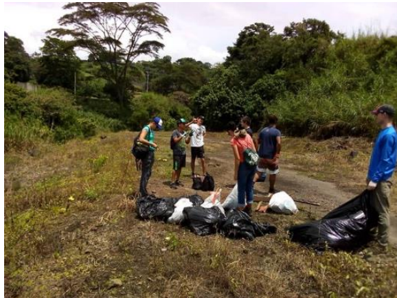
Ilustración 13: Parte de las personas participantes y de los residuos recolectados ese día

El 28 de setiembre del 2019 se llevó a cabo una nueva limpieza el Río Virilla. Lo novedoso de este evento, es que después de gestiones repetidas con la municipalidad se logró que tanto el gobierno local de Santo Domingo como el de Tibás se unieran a los esfuerzos de la comunidad, a través de la recolección de los residuos que se extrajeron del río, ya que en el pasado la Asociación Casa Adobe, se había hecho cargo de trasladarlos hacia un lugar adecuado para su disposición. Esto constituyó un verdadero adelanto en la intervención.