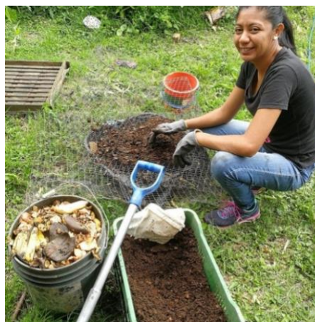
Ilustración 17: Una de las voluntarias de La Asociación Casa Adobe procesando los desechos orgánicos recolectados de las familias de Santa Rosa.

A pesar de este obstáculo, la comunidad de Santa Rosa continúa organizándose para evitar que los residuos lleguen al río. Es así como ahora se está impulsando un proyecto de recolección de residuos orgánicos con la participación de 15 familias del barrio. Estos residuos son convertidos en abono orgánico, el cual es devuelto a las familias que participan, para que lo puedan utilizar en sus propias huertas.