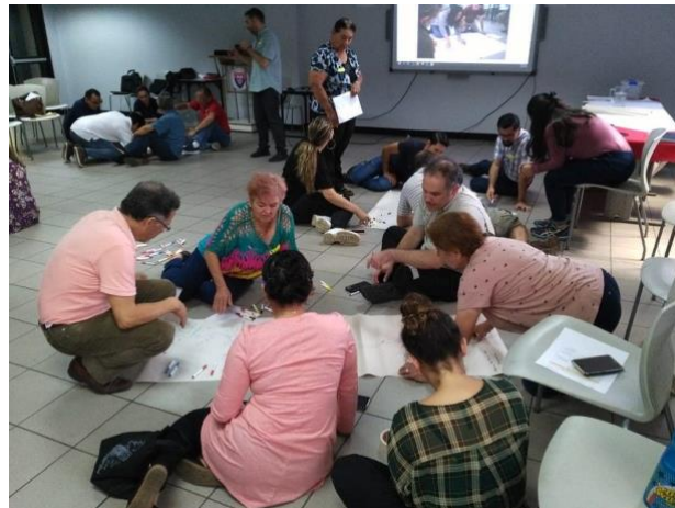
Ilustración 14: Parte de las personas participantes en El Taller De Cartografía

Este taller tenía como objetivo mapear las áreas de protección y otras áreas verdes urbanas a partir de un diálogo entre personas y barrios a lo largo del Río Bermúdez que es afluente del Río Virilla. Sin embargo, también permitió conocer de otras experiencias de personas trabajando por la defensa de los ríos y cuencas en la zona urbana de Heredia, lo cual constituyó un elemento muy importante para la construcción de redes de apoyo.