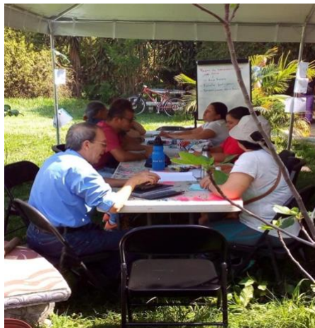
Ilustración 7: Personas que participaron en el taller de recuperación de la memoria del río Virilla