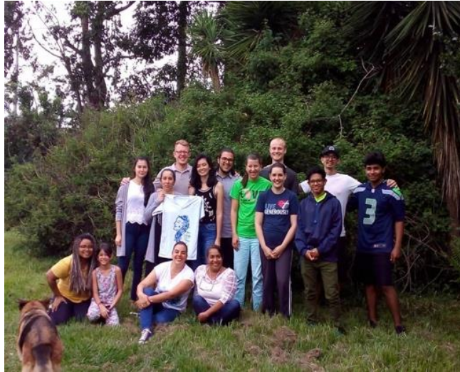
Ilustración 12: Participantes del Taller La Cuenca Canta