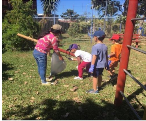
Ilustración 16: Parte de las niñas y niños que participaron en la limpieza de las calles de Santa Rosa

A partir del año 2020, la organización para eventos que impliquen reunir gente e ir al río, han sido muy difíciles de realizar. Por ejemplo, se inscribió nuevamente al Río Virilla para participar en la Séptima Jornada de “Mi picnic en el río”, pero debido a la pandemia fue suspendido.