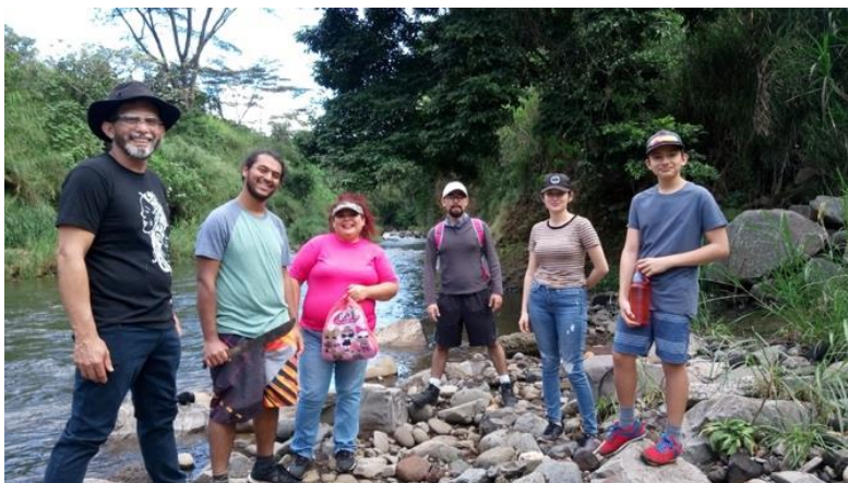
Ilustración 15: Parte de las personas asistentes a la última caminata y limpieza del río organizada en 2019.

El 7 de diciembre de 2019, se realizó la última caminata y limpieza del año 2019. En esta ocasión también se contó con la colaboración de la municipalidad de Tibás y Santo Domingo para disponer de los desechos recolectados.