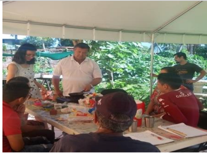
Ilustración 10: Personas que asistieron al segundo taller de reutilización de plástico de un solo uso.