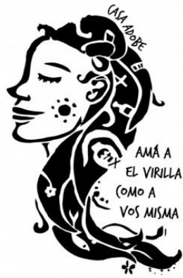
Ilustración 8: Logo del movimiento del río Virilla, elaborado por Zachary Stewart a partir de aportes de personas asistentes al taller de recuperación de memoria histórica

Esta indagación permitió hacer un análisis de género y al mismo tiempo, comprometernos con reivindicar el nombre del Río Virilla.