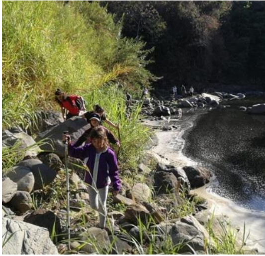
Ilustración 3: Participantes de la caminata al río Virilla