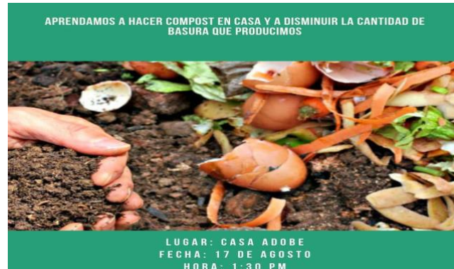
Ilustración 11: Afiche utilizado para promocionar el taller de compostaje.

Se dieron técnicas para la elaboración de compostaje en los hogares, sus usos y los beneficios para las plantas y las fuentes de agua.