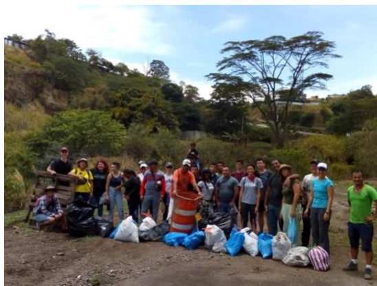
Ilustración 4: Muestra de la cantidad de basura recolectada ese día y las personas participantes en el evento

realizando la misma actividad, abrió la puerta para experimentar al río como parte importante de la comunidad.