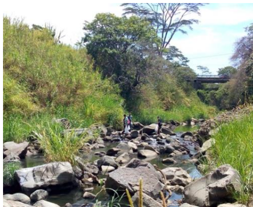
Ilustración 6: Jóvenes participantes de la limpieza.

Esto permitió la participación de varios adolescentes de la comunidad en la actividad, quienes manifestaron que era la primera vez que habían tenido la oportunidad de visitar el río, lo cual sirvió a las personas asistentes para dimensionar la pérdida del espacio público del río, como un lugar para construir historias y fomentar en la población más joven el sentido de una ciudadanía cuidadora, que de acuerdo con el planteamiento de Comins (2015), tiene importantes implicaciones políticas para la transformación y el cambio social.