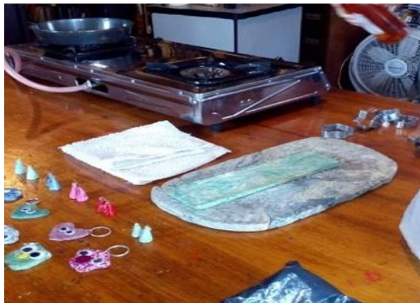
Ilustración 1: Ejemplo de los productos elaborados a partir del plástico de un solo uso