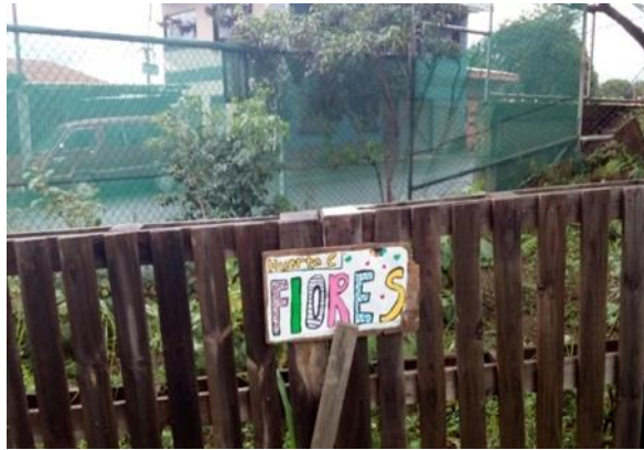
Ilustración 2: Muestra del trabajo de decoración realizado por las niñas y niños