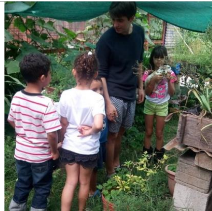
Ilustración 9: Taller de huertas dirigido a niñas y niños de Santa Rosa.

Por otro lado, en este taller se contó con la presencia del presidente municipal, lo que indicó que el trabajo por el rescate del río Virilla, estaba empezando a sonar entre las esferas políticas de Santo Domingo, reconociendo que ya se estaba logrando cierto nivel de incidencia para el cambio social.