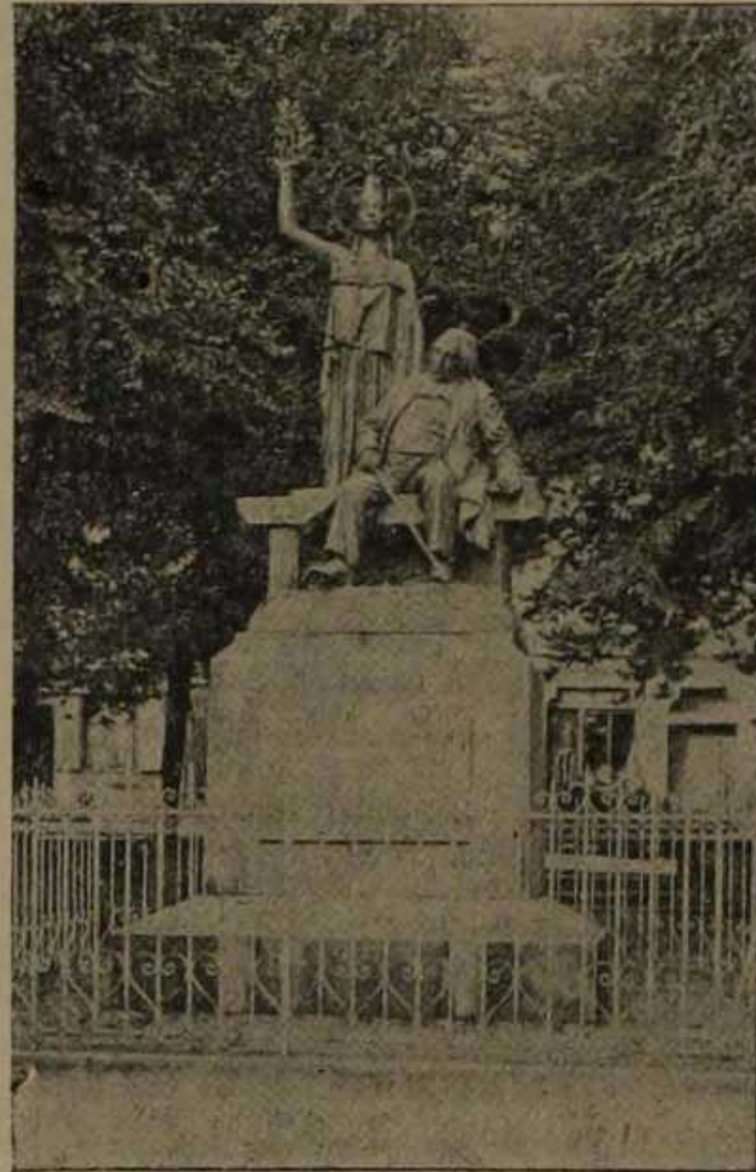
La estatua de RENÁN en la plaza de Tréguier, al lado de la Catedral.