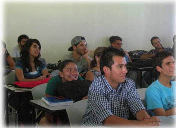
Fig. 10. Cine Foro. Estudiantes universitarios del Centro de Estudios Generales. 7 setiembre del 2013.

Para trabajar con estos grupos, se recurrió a la técnica del cine-foro, con la película “Elsa y Fred” como estrategia didáctica de enseñanza.