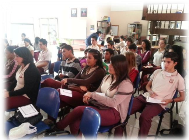
Fig. 11. Cine Foro. Estudiantes del Colegio Vocacional de Heredia. 3 setiembre del 2013.

mayor, con lo cual pudieron entender que ésta se encuentra presente en toda