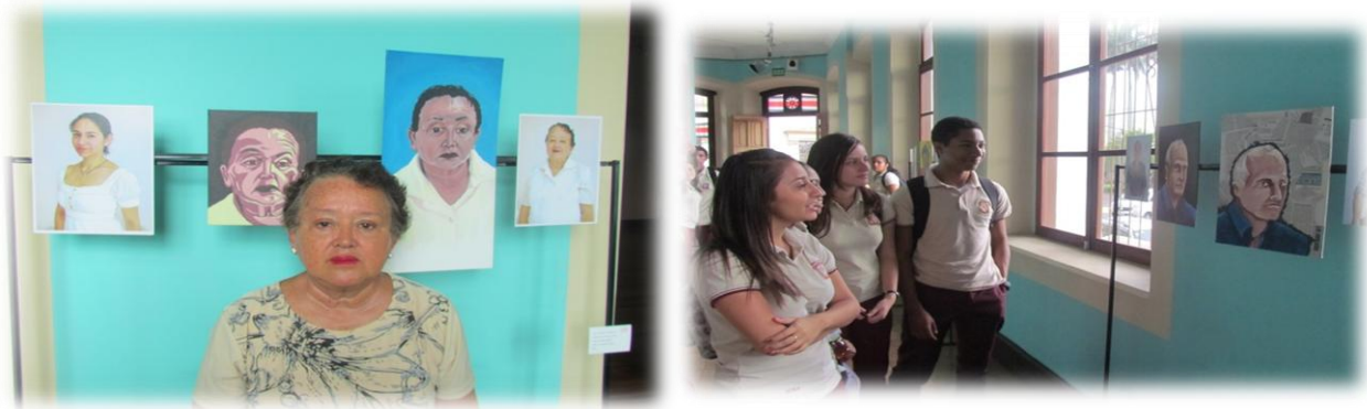
Fig. 4. Exposición artística. Heredia 2013