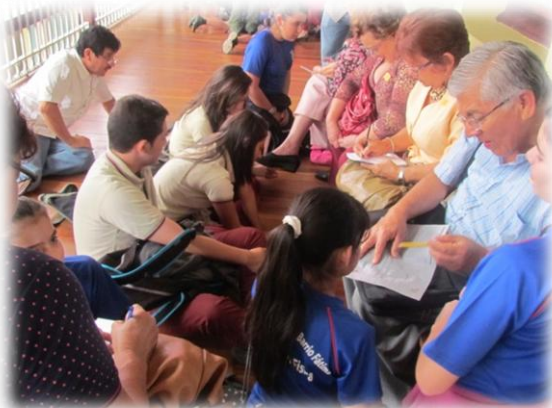
Fig. 13. Encuentro Intergeneracional. 1 de octubre del 2013.

Fue en los dos encuentros intergeneracionales donde los participantes apreciaron una forma distinta de expresión sobre el valor de las personas adultas mayores en nuestra sociedad. Resultó también la oportunidad idónea para experimentar la condición de salud de las personas adultas mayores, así como algunas de las características por ellos mencionadas como las arrugas, las canas y