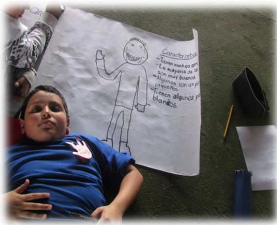
Fig. 8. Taller sensibilización, Escuela de Fátima, 4 setiembre del 2013. Previo al Encuentro Intergeneracional.

Fue en este espacio donde se les explicó que la vejez no es sinónimo de enfermedad o de deterioro físico, pues una persona adulta mayor, como cualquier otra persona joven, puede enfermarse o poseer una limitación física. Con la actividad pudieron reflexionar y entender lo que