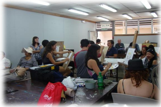
Fig. 3. Taller de Pintura 4. Estudiantes de la Escuela de Arte y Comunicación Visual y personas adultas mayores del PAIPAM.

expuestas a estudiantes de secundaria para observar sus reacciones.