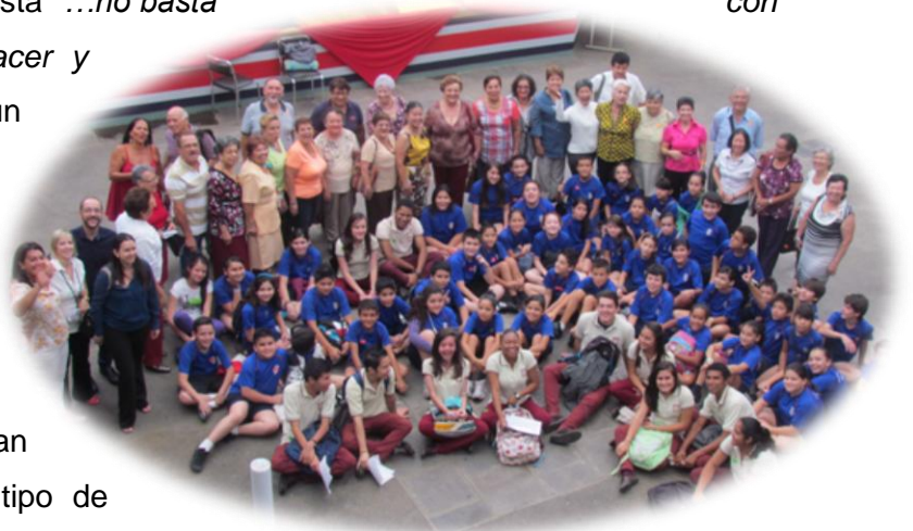
Fig. 1. | Encuentro Intergeneracional, Heredia 2013

Son muchos los beneficios de los PI para las generaciones participantes, en el caso del proyecto “Banco de la Sabiduría Popular” se podría mencionar que la iniciativa, la flexibilidad, la empatía, la creatividad y los nuevos conocimientos sobre el envejecimiento y la vejez, libre de mitos y estereotipos son de los principales beneficios, pues “ a medida que los participantes aprenden a cambiar sus ideas sobre los otros, se va produciendo de modo simultáneo una autoreflexión y va teniendo lugar un proceso de entendimiento del propio Yo ” (McGowan y Blankenship, 1994, citado por Pinazo y Kaplan (2007)).