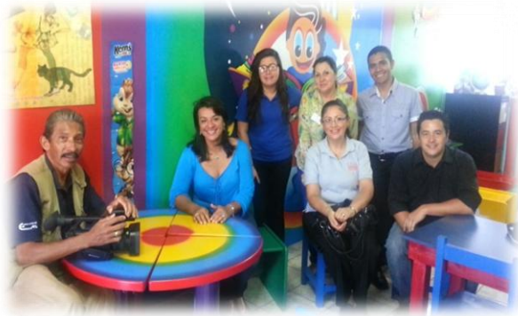
Fig. 2. Parte del equipo ejecutor, taller Escuela de Fátima, 4 setiembre del 2013.

Para la puesta en marcha del proyecto se conformó una comisión integrada por un representante de cada una de las instancias involucradas, quienes mediante reuniones quincenales daban seguimiento a cada una de las acciones planificadas. En el caso de la Agencia de