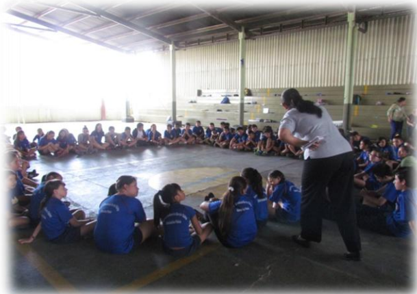
Fig. 9 Sesión de diálogo con los niños de la Escuela de Fátima, 4 setiembre del 2013.

( http://www.telegrafo.com.ec/palabra-mayor/item/comprender-los-mitos-y-estereotipos-cambiara-la-mirada-del-envejecimiento-y-la-vejez.html ).