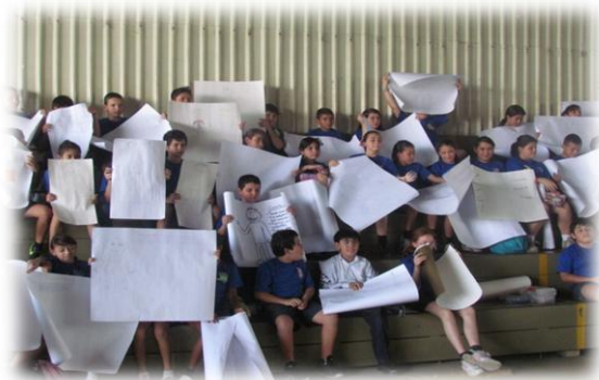
Fig. 6. Taller sensibilización, Escuela de Fátima, 4 setiembre del 2013. Previo al Encuentro Intergeneracional.

A través de los dibujos, se logró develar los imaginarios de los niños respecto a la vejez,