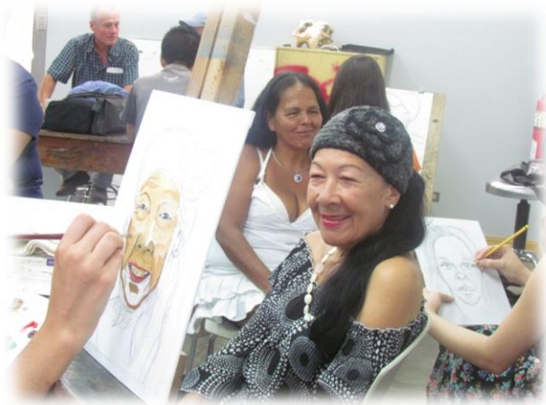
Fig. 12. Encuentro de Jóvenes universitarios y personas adultas mayores en el taller de Pintura 4.

Experiencia que también vivieron los jóvenes del curso de Pintura 4, aunque con una metodología distinta, pues fue en los talleres donde se compartió vivencias y experiencias de ambos grupos. A través de la técnica del retrato, la profesora del curso busco que sus estudiantes plasmaran no solo los rasgos externos (físicos), sino también los internos (psicológicos) de las personas adultas mayores.