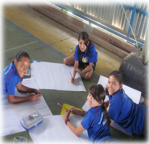
Fig. 5. Taller sensibilización, Escuela de Fátima, 4 setiembre del 2013. Previo al Encuentro Intergeneracional.

Como se dijo, para el trabajo con los niños se utilizó como herramienta de formación y de análisis la técnica del dibujo considerando la flexibilidad de la misma, su aplicabilidad a diferentes grupos etarios, el tiempo de ejecución del taller y el fin a cumplir. La idea era que a través de una forma muy práctica y participativa, los niños pudieran reflexionar sobre las creencias erróneas aceptadas como normales que tiene sobre lo que es ser “viejo”.