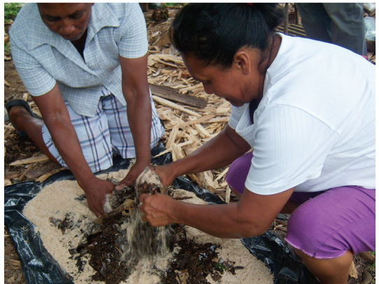
Agricultores elaborando sus propios abonos orgánicos, Talamanca.