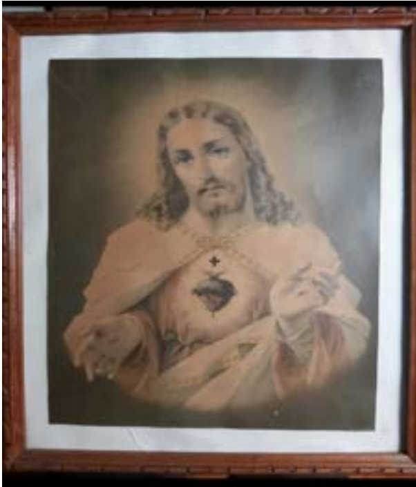
Imagen # 11 Cuadro del Corazón de Jesús propiedad de Doña Lourdes Fallas. 350