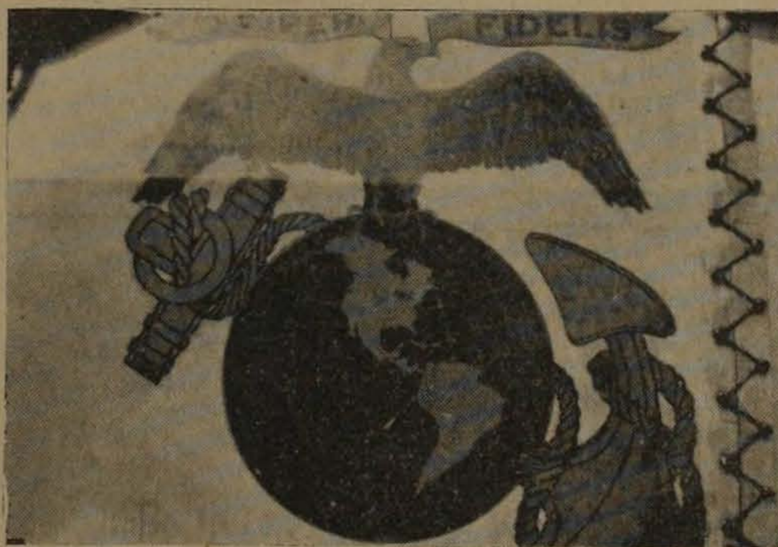
Sugestiva insignia, estampada a los flancos de los aviones que en Nicaragua hostigan a Sandino. Arriba dice el letrero: Semper Fidelis . Y abajo hay otro que dice: U. S. Marines. Comentario: El que tenga oídos, que oiga; y el que tenga ojos, que vea.

México, profetizo formalmente, está sentenciado a pasar bajo las Horcas Caudinas; si no se realiza en un solo asalto, será en varios, fragmento a fragmento, (Texas y la Baja California), pero ello será al fin. Los grandes estadistas que operan en Washington, cualquiera que sea su imbecilidad en otros extremos, tienen sin duda un sutil conocimiento de los de su clase; saben bien que para un político profesional, el principio y el fin de las cosas es su «tajada», su «jamón.» Désela, asegúresela y recibirá órdenes hasta la consumación de los tiempos, ya sea de Wall Street o de Main Street, del Trust de la Bebida o de la Liga Anti-Alcohólica, del Papa o del Diablo. Este simple y elemental principio conforma la política americana del Caribe. La treta se lleva a efecto poniendo en los puestos públicos a hombres seguros y sanos manteniéndolos en ellos con la punta de las bayonetas. Se la ha empleado en Cuba, en Santo Domingo y en Haití; se la utiliza ahora en Nicaragua y se practicará eventualmente en cualquiera de las repúblicas de El Paso a Colón.