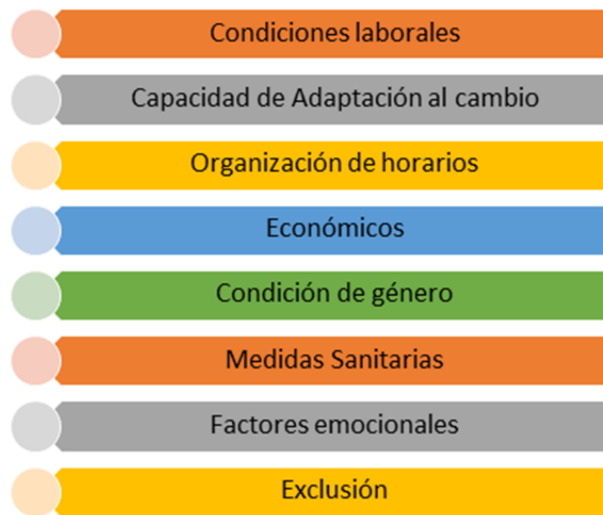
Figura 4. Categorias de ajustes ante un eventual regreso.

Algunas de las personas estudiantes que se encuentran en condición laboral indican posibilidades ante el eventual regreso a la presencialidad de las aulas, señalan tener que acudir a cambios de horarios o incluso tendrían que renunciar a su trabajo actual. Respecto a la capacidad de adaptación se debe toma en cuenta que un considerable grupo de estudiantes nunca han tenido la oportunidad de estar recibiendo clases en la universidad y este regreso marcaría su primer contacto formal, por lo que además deben considerar aspectos económicos como pasajes y alimentación, así como desplazamientos de zonas alejadas del país.