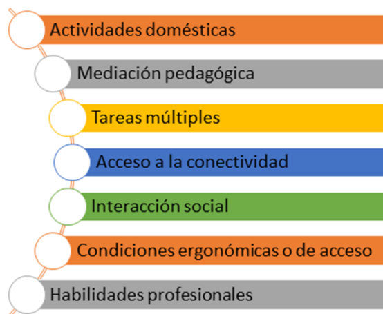
Figura 1. Categorías de limitaciones en la virtualidad de la oferta educativa.

Como parte del proceso de consulta también sobresalieron aspectos negativos o limitaciones que marcaron las rutas de aprendizaje del estudiantado durante el período que se ha aplicado la virtualización de la oferta educativa. De las temáticas que fueron indicadas se desprenden las categorías señaladas en la figura 1, la cual se muestra a continuación: