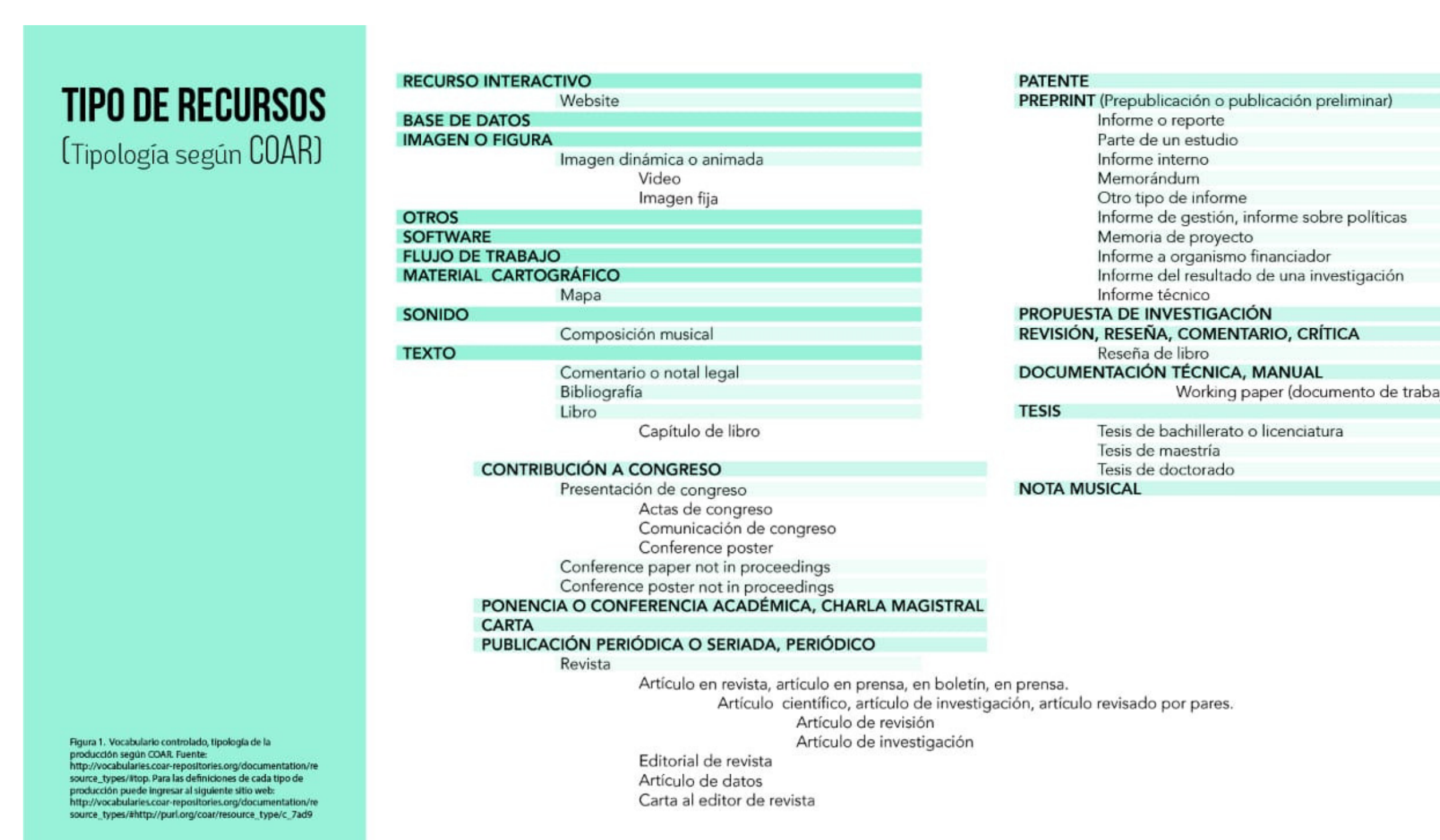
Figura 2. Nueva tipología según COAR