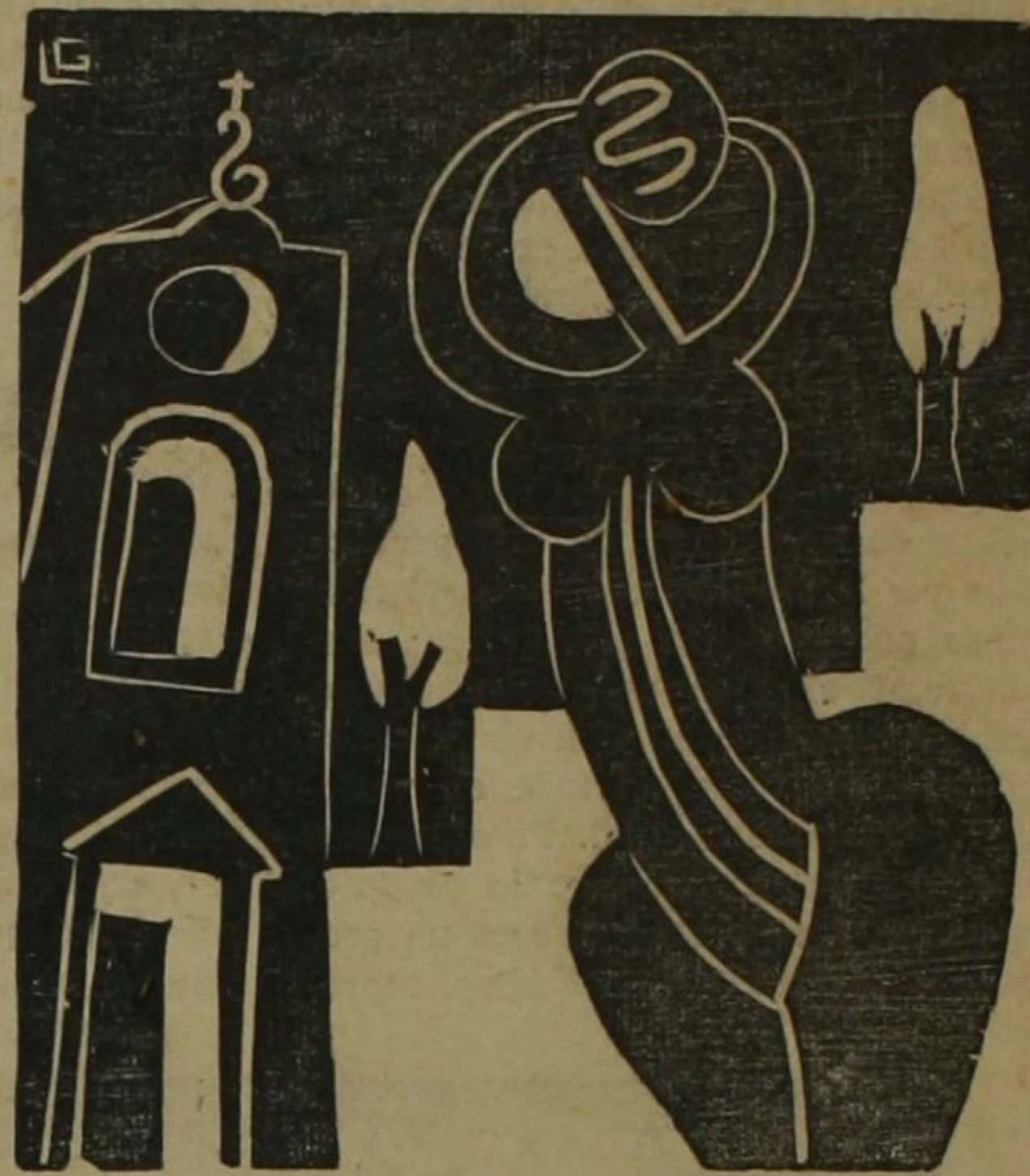
(Madera de Laporte)

A menudo, cuando salgo a pasear tarde en la noche, me pongo a ver las casas; algunas están a oscuras, otras dejan escapar una luz