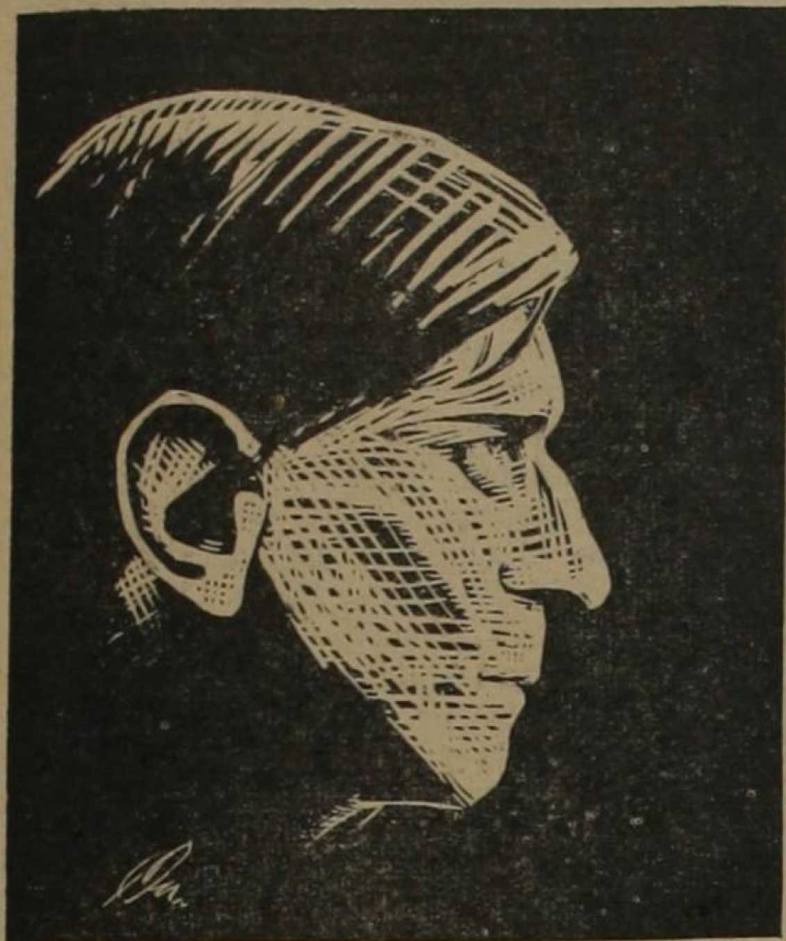
José Carlos Mariátegui