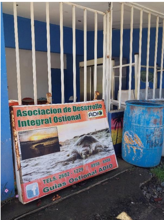
Parte de las instalaciones de la ADIO y la fachada de la Planta de Empaque desde la playa