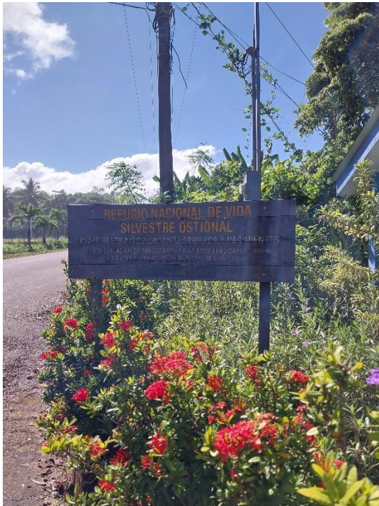
Entrada al Refugio de Vida Silvestre en Ostional y la Planta de Empaque