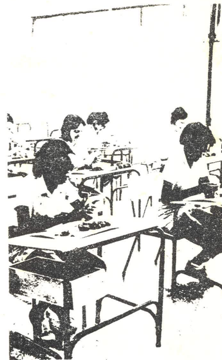
FACULTAD DE CIENCIAS Y LETRAS ACTO DE INAUGURACION DE LA NUEVA FACULTAD Y SU PABELLON CENTRAL, Y BIENVENIDA A LOS ES- TUDIANTES DE 1º AÑO. Ciudad Universitaria 4 de marzo de 1957