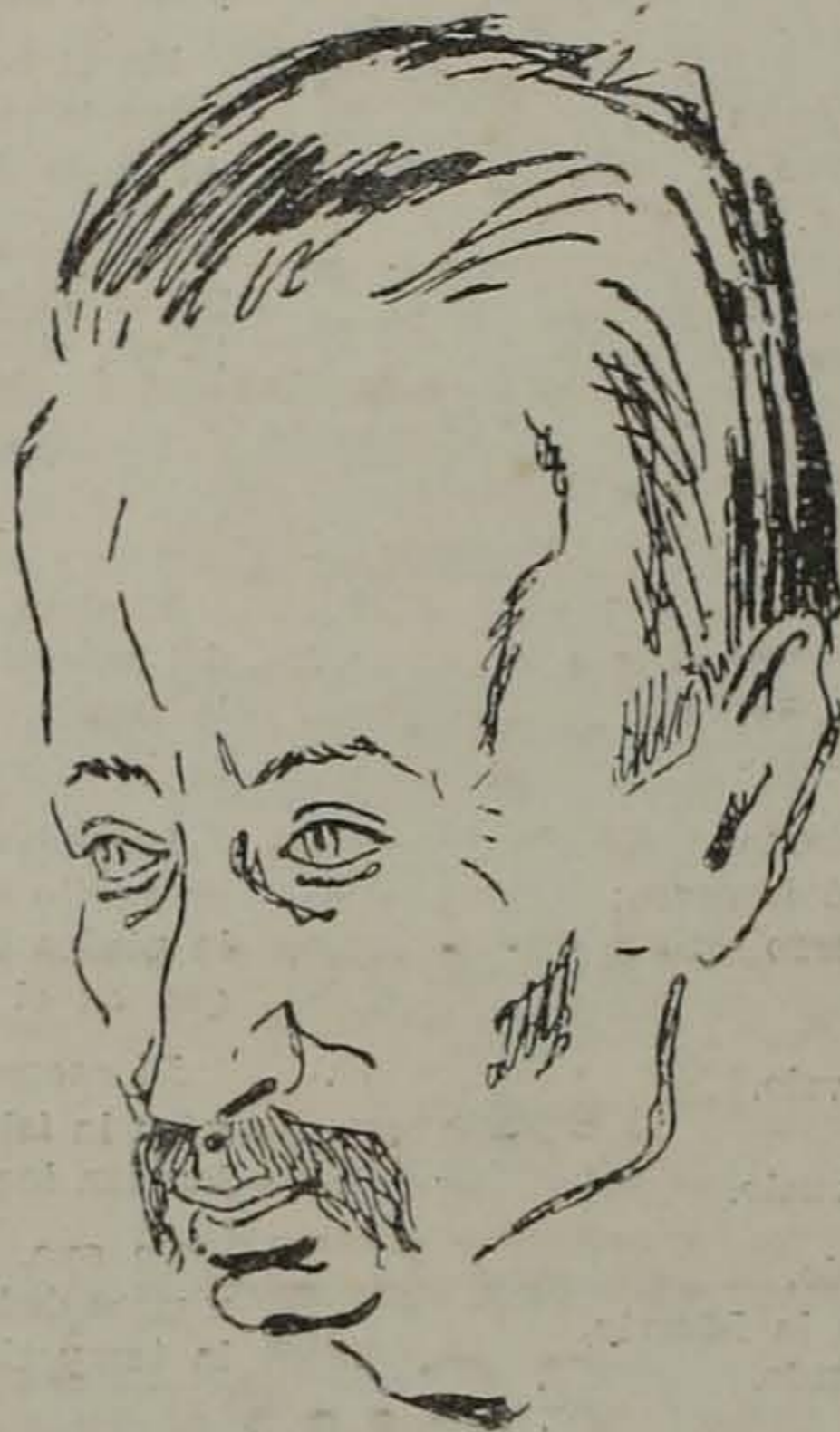
Rainer María Rilke

Veía yo a Rilke como aquel que gozó sobre todos los poetas y hasta con exceso, de inclinarse hacia ese lado en que la más viva imagen de los seres se hace recuerdo. Me parecía como si hiriese a la delicadeza de su espíritu el contacto cercano y le fuera necesario poner entre él y su mundo al menos el límite de una atmósfera. Por ello comprendía el por qué de su gustar con tal deleite de los encantos de lo lejano, de lo que se