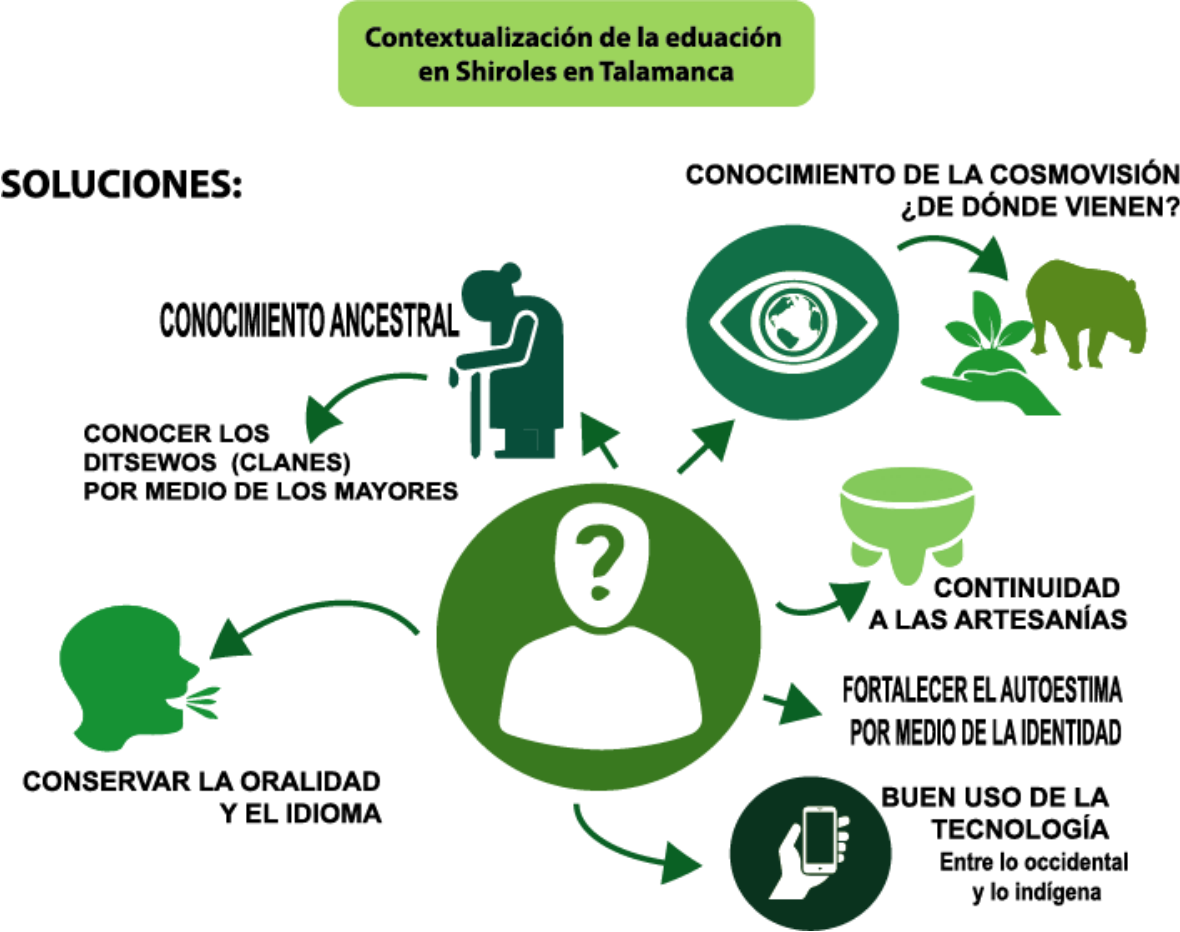
Figura 5. Esquema Grupo focal (Soluciones a la contextualización de la educación indígena)