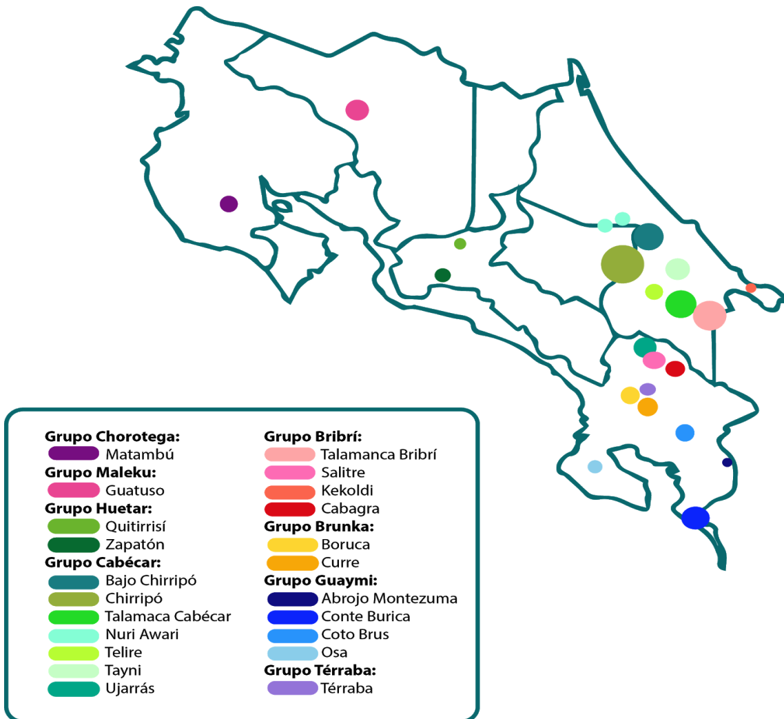
Zonas indígenas de Costa Rica, Calderón M, 2018