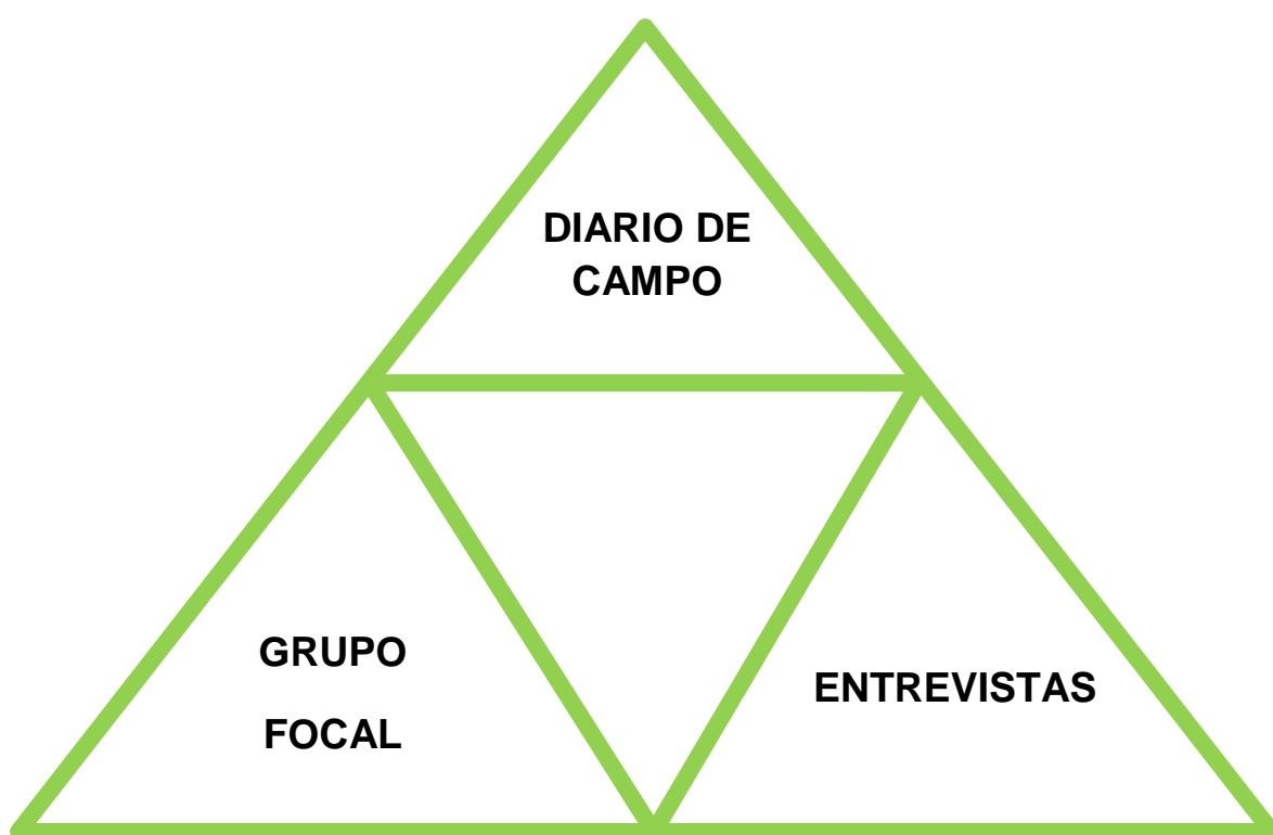
Figura 5. Esquema de Instrumentos para triangulación.

Nota: Confección personal. Calderón M, 2018.