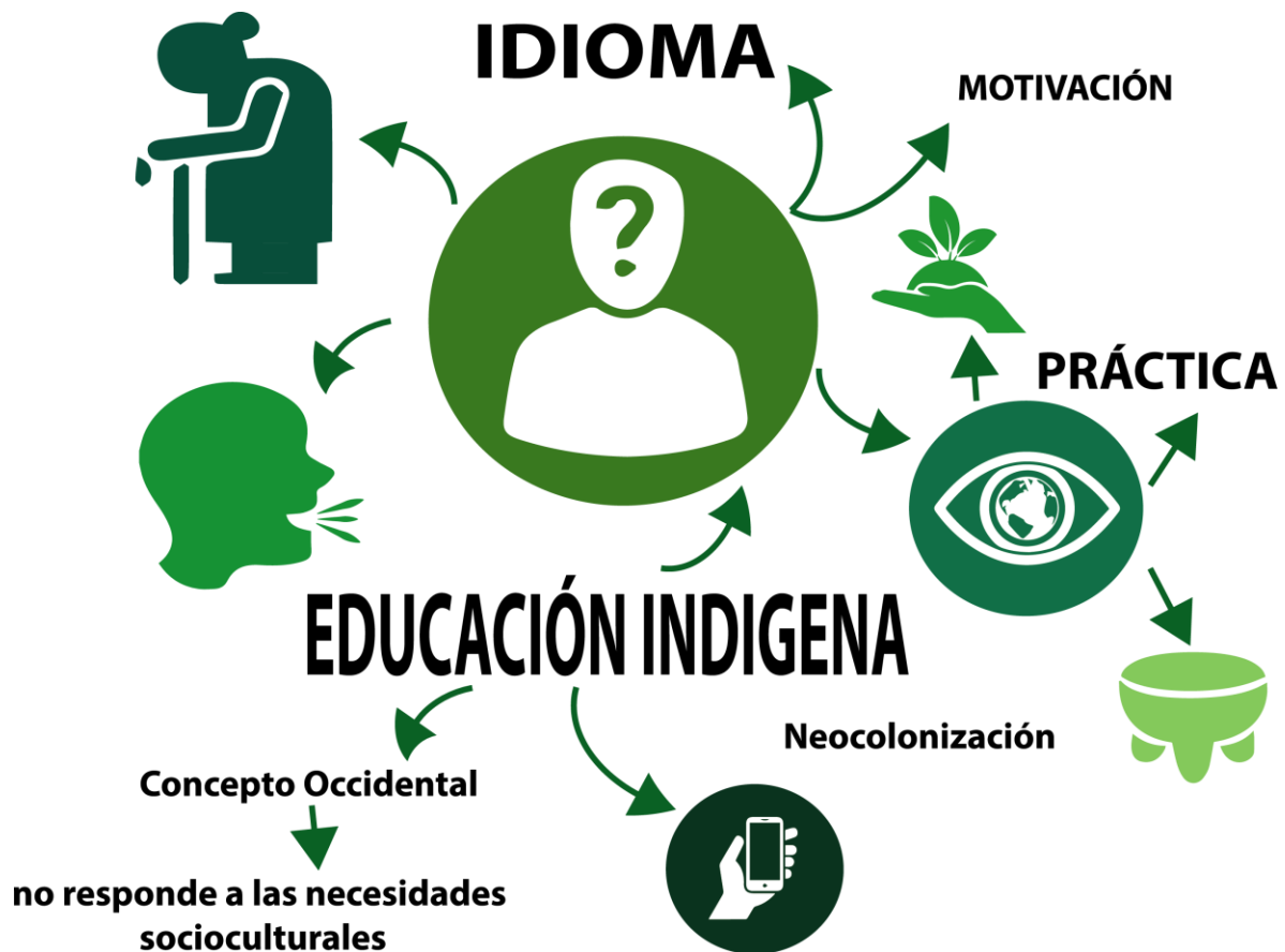
Figura 2. Esquema de Análisis de Entrevistas

Nota: Confección personal. Calderón M, 2018