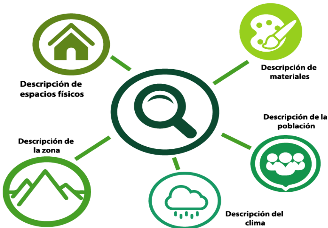
Figura 3. Esquema de Análisis Global de Diario de Campo

Nota: Confección personal. Calderón M. y Navarro J, 2018