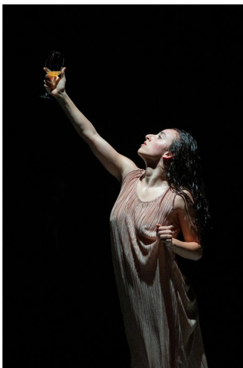
Figura 19: Socialización de Piel de Gallina (2025).