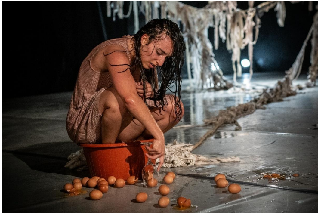
Figura 15: Socialización de Piel de Gallina (2025).