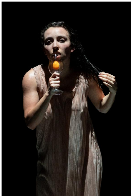
Figura 18: Socialización de Piel de Gallina (2025).