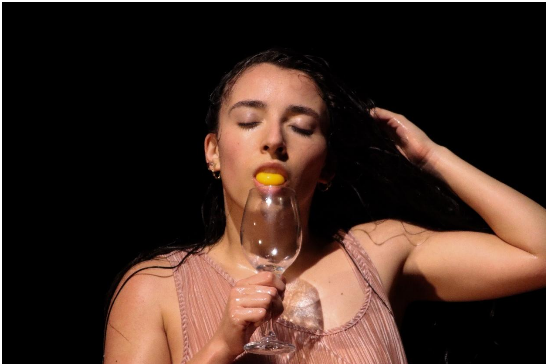
Figura 11: Muestra coreográfica al equipo asesor.