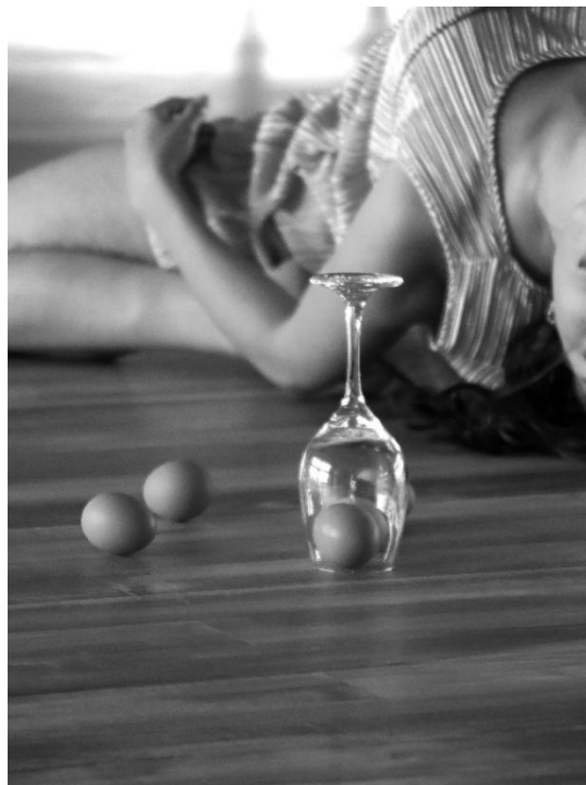
Figura 6: Muestra de avance coreográfico en la Escuela de Danza, corresponde a una etapa avanzada del proceso creativo (2025).