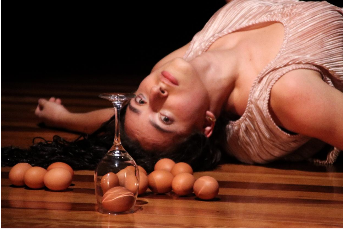
Figura 10: Muestra coreográfica al equipo asesor.