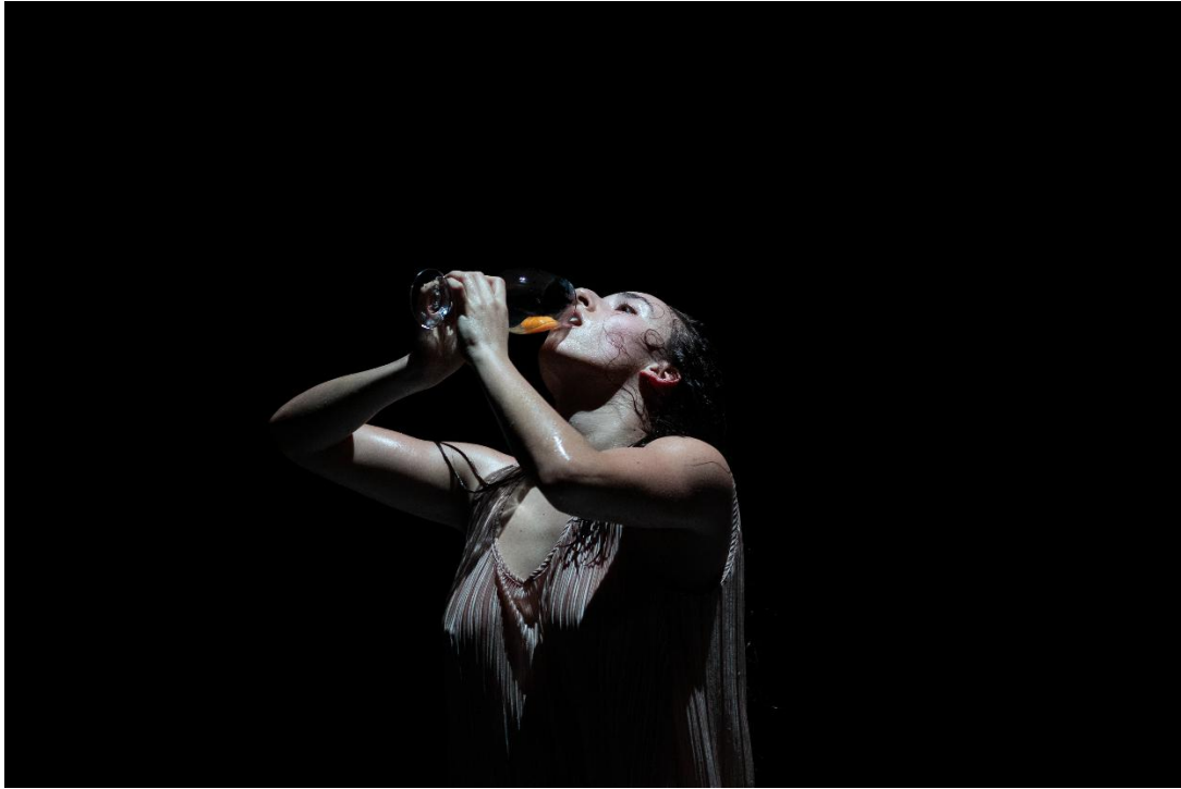
Figura 16: Socialización de Piel de Gallina (2025).