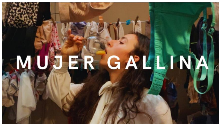
Figura 3: Cortometraje "Mujer Gallina" (2024), de autoría propia. Articula los principales elementos compositivos, configurándose como el primer boceto coreográfico de Piel de Gallina.

Explora la relación simbólica entre la mujer y la gallina construida por los discursos sociales, utilizando el huevo como elemento plástico.