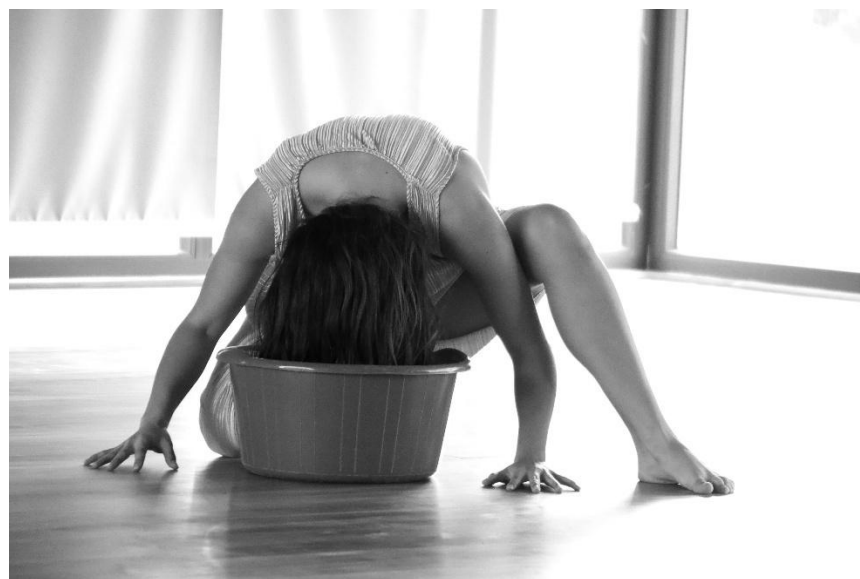
Figura 7: Muestra de avance coreográfico en la Escuela de Danza, corresponde a una etapa avanzada del proceso creativo (2025).