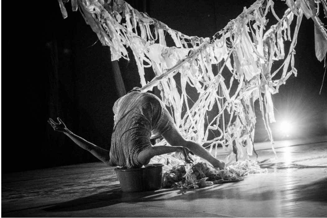
Figura 14: Socialización de Piel de Gallina (2025).