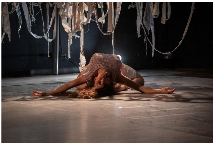
Figura 12: Socialización de Piel de Gallina (2025).

Anexo 3. Registro fotográfico de Piel de Gallina en la presentación coreográfica final de la Maestría Profesional en Danza con Énfasis en Coreografía, realizada en el Teatro Centro para las Artes, Universidad Nacional de Costa Rica.