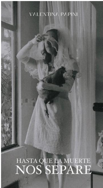
Figura 2: Cortometraje "Hasta que la muerte nos separe" (2023), de autoría propia.

Explora la relación simbólica entre la mujer y la gallina construida por los discursos sociales, utilizando el huevo como elemento plástico.