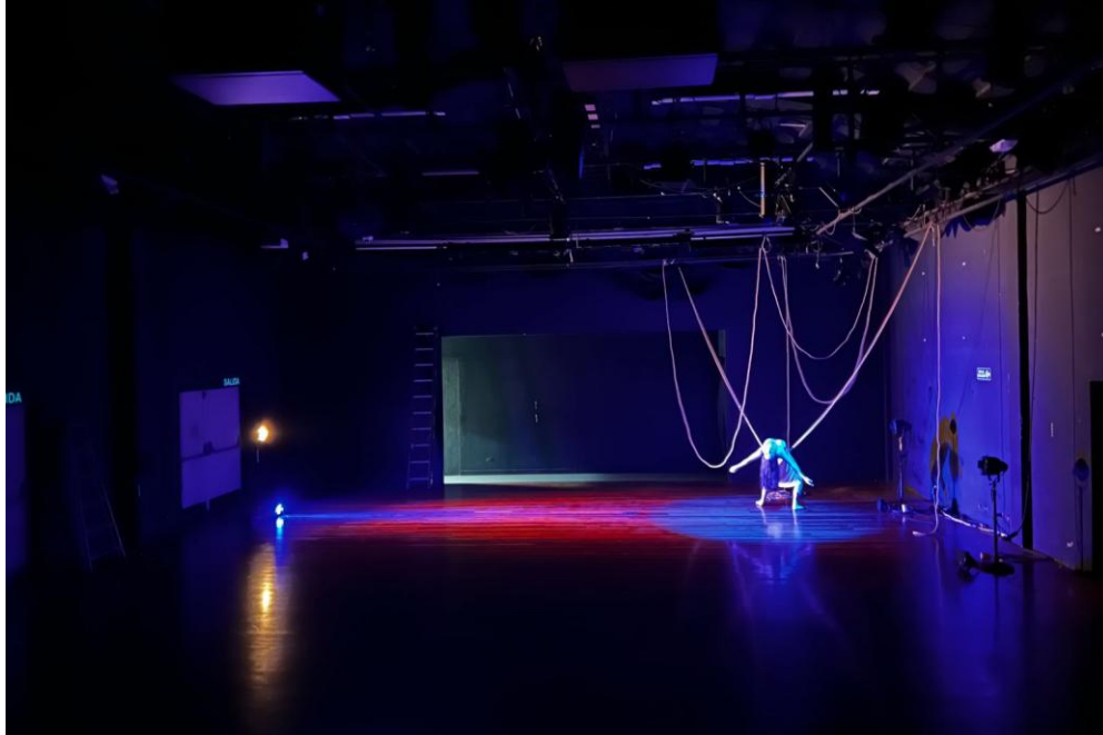
Figura 8: Rediseño, instalación y exploración del tendedero en el espacio escénico.