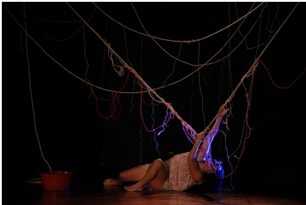
Figura 9: Ensayo en el teatro y muestra coreográfica al equipo asesor, versión del tendedero previa a su configuración final.