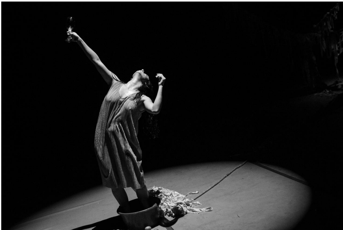
Figura 17: Socialización de Piel de Gallina (2025).