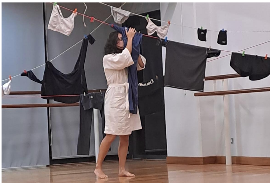
Figura 5: Exploración coreográfica del tendedero, en su formato tradicional, como elemento plástico (2024).