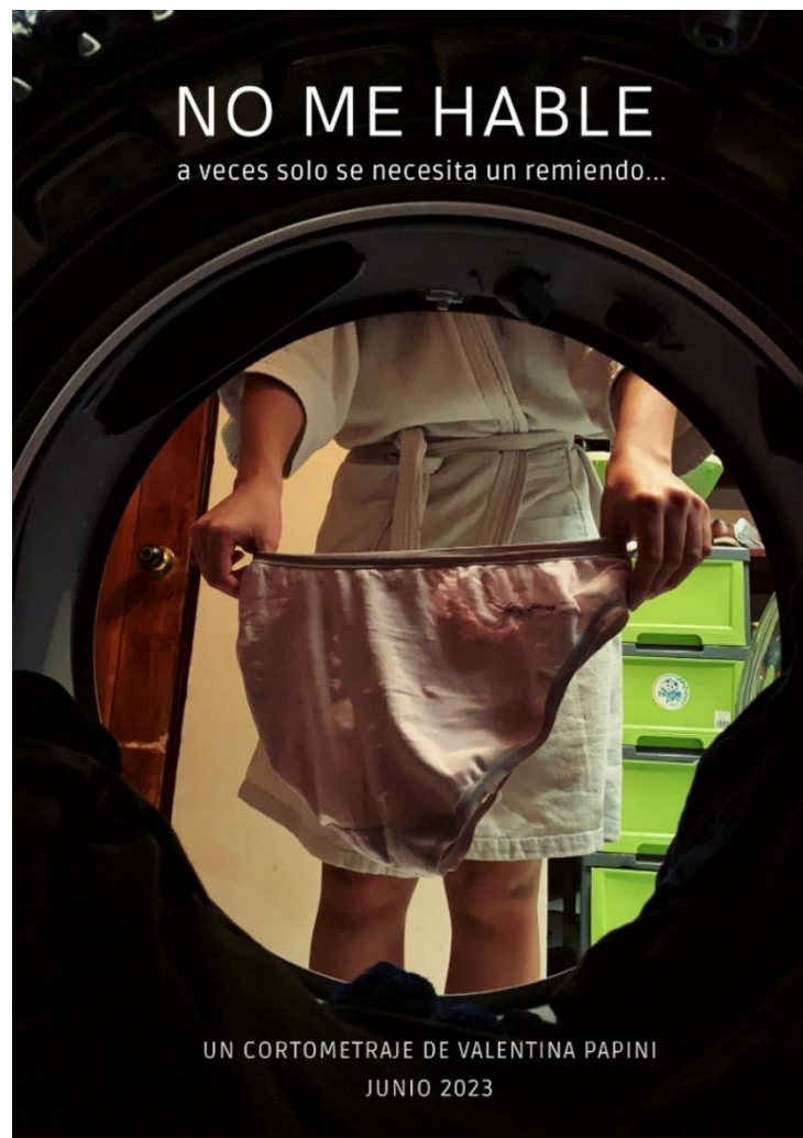
Figura 1: Cortometraje "No me hable" (2023), de autoría propia. Explora la construcción de la mujer domesticada.

Anexo 1. Artes gráficas de ejercicios de creación coreográfica desarrollados durante la Maestría Profesional en Danza, utilizados como detonadores creativos en el proceso de creación de Piel de Gallina .