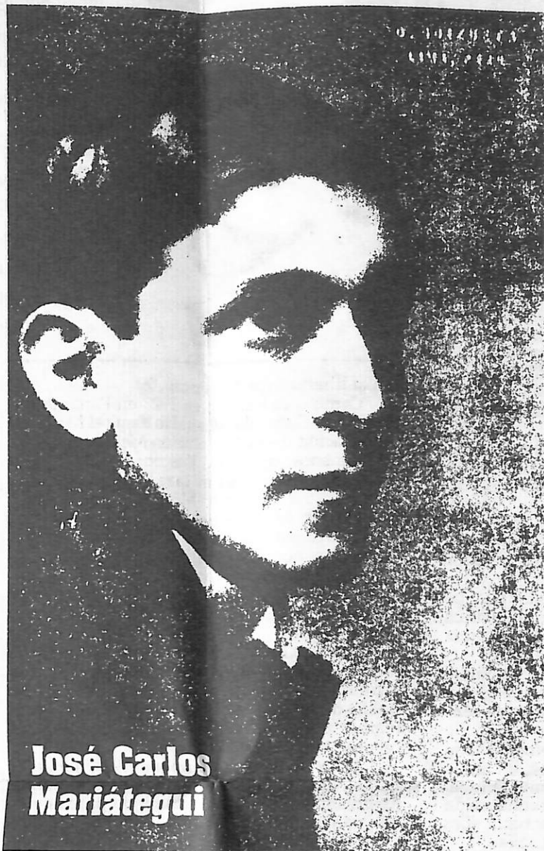
José Carlos Mariátegui

Cuando José Carlos Mariátegui y Víctor Raúl Haya de la Torre (1895-1979) se enfrentan, en las primeras décadas del presente siglo, a la realidad de su entorno geográfico y cultural, no pensándolo por cierto, en términos de las determinaciones del estado nacional peruano, sino en una perspectiva regional, se dan cuenta de las enormes diferencias que presentan estas sociedades en relación con las que se habían venido gestando, durante muchos siglos, en Europa. No había pues, una relación de corres-