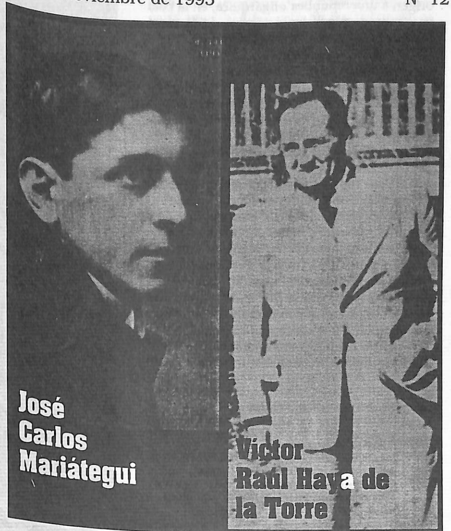
José Carlos Mariátegui