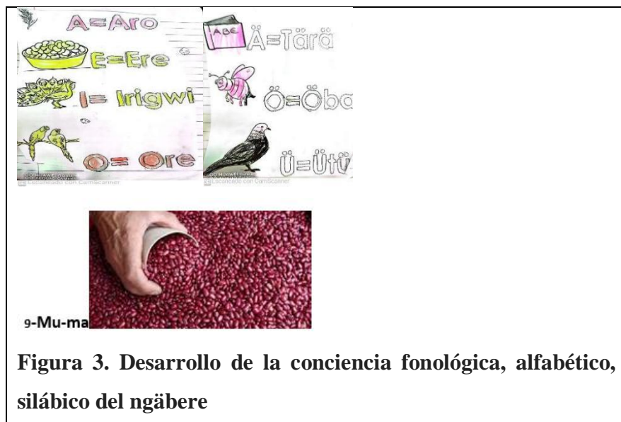
Figura 3. Desarrollo de la conciencia fonológica, alfabético, silábico del ngäbere

Desarrollo de la conciencia fonológica, alfabético, y silábico en ngäbere.