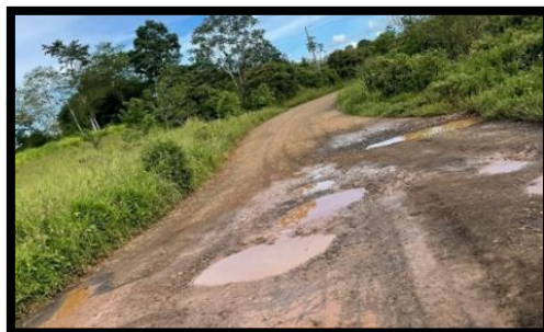
Figura 3 Carretera a Coquital

Por otra parte, si se requiere llegar al centro de Los Chiles, deberán trasladarse unos 8 kilómetros más desde El Parque, con las limitantes por el escaso transporte, ya que el bus sólo pasa una vez al día en horario de 6:00 a.m. sale de Santa Fe y regresa a las 12:00 p.m., información proporcionada por grupo focal (Apéndice G), quien es copropietaria del servicio de transporte a estas comunidades.