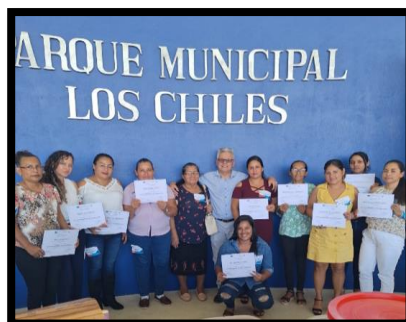
Figura 9 Capacitación

Por otra parte, se les rediseñó el logo que representa uno de los productos artesanales hechos en horno a la leña el cual fue una de las solicitudes para un nuevo taller que realizaron llamado: Formación en gestión empresarial, con Cámara Empresarial de la Mujer del Caribe y la Fundación Arias para la Paz y el Progreso Humano, en el que se les contribuye con una presentación visual, con el objetivo de convencer a los jueces del emprendimiento que están llevando a cabo y así ganar capital semilla para su asociación, gracias a ello, la entrevistada 4, “comunica la noticia de que ganaron la donación de equipo importante que dará apoyo a su proyecto”. Este equipo donado consta de: un horno semi industrial, una licuadora y una mesa para trabajo, favoreciendo en aporte a capital activo, con su primer equipo necesario para la elaboración de sus panes. Figura 9, expone capacitación de gestión empresarial.