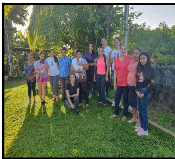
Figura 4 Grupo focal mujeres de Coquital

Las mujeres, además de sus aportes como esposa, madre, ama de casa, etc. Tienen la capacidad de cumplir con roles que contribuyen al desarrollo político, económico y social. Aun así, en algunos casos estas siguen siendo relegadas y subestimadas en las diferentes áreas de la sociedad. Los espacios de participación de las mujeres se ven condicionados, porque la sociedad las limita haciendo preferencia a la acción masculina, sin valorar la calidad de aporte que pueden ofrecer y que, a pesar de la falta de preparación, estudios o experiencia, son capaces de transformar diferentes contextos sociales; su espíritu de lucha anima a otras mujeres a participar activamente para lograr dar pasos importantes, tanto en su desarrollo personal, económico, político y social; además, permitiendo que se acorten las brechas de desigualdad. Entrevistada 4, nos indica que “ella para sostener su hogar hace pan, algunas comidas para vender y con esto se ayuda para los estudios de sus hijos” Esto hace que sean un ejemplo de lucha y esfuerzo en sus comunidades y para lo que es el pueblo de Coquital.