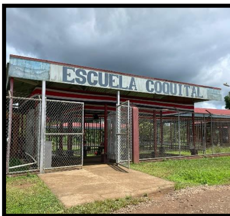
Figura 2 Escuela de Coquital

Datos proporcionados por la entrevistada 4, nos dice que: la escuela cuenta con 170 niños, 6 aulas, 8 baños, 8 docentes y el director, el centro educativo se encuentra bien en infraestructura. Sin embargo, se carece de otras condiciones como: espacios educativos en niveles postsecundarios, como técnicos, universitarios, pocas capacitaciones tituladas (educación no formal), aunque sí llegan algunas entidades que ofrecen formaciones que han servido para generar pequeños ingresos a familias o mujeres jefas de hogar.