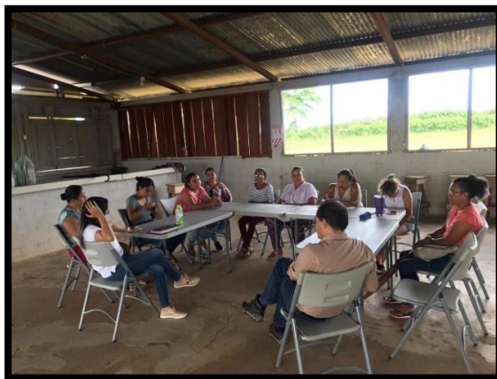
Figura 6. Reunión personeros INDER

En esta reunión las señoras de la asociación expusieron su historia y experiencia en el tiempo transcurrido desde su organización, se dan a conocer las ideas que tienen para su emprendimiento, además de las necesidades y limitaciones que tienen para poderlo llevar a cabo, de esta manera han tratado de buscar alternativas para poder alcanzar el objetivo propuesto; una vez dado a conocer ante los personeros del INDER el contexto del grupo se les pide orientación en cuanto a las colaboraciones que ellos podrían ofrecer.