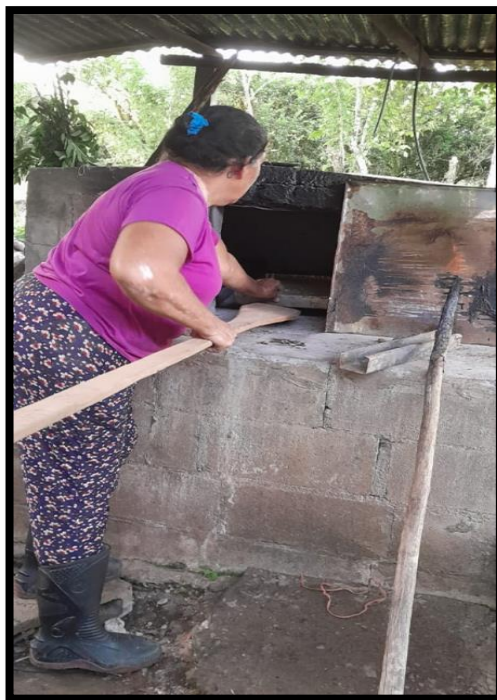
Figura 7 Elaborando pan artesanal

Esta institución también se comprometió a llevarles una capacitación impartida por el INA, basada en el área que ellas necesitan, enfocado en la producción y elaboración de panes artesanales e industriales (panadería) y como plus manifiestan hacer llegar esta capacitación específicamente en su comunidad.