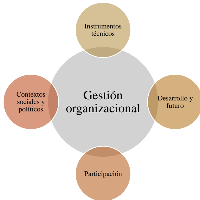
Ilustración 2. Objeto y objetos de segundo grado

convertir, al igual que las técnicas de organización, en un objeto de estudio, pero en función de la gestión organizacional. Es decir, la planificación, con apoyo de otras disciplinas, puede colaborar en la construcción de futuros para el desarrollo de estrategias desde diferentes instituciones y organizaciones. Es un objeto de segundo grado. Esto se podría decir, también, con respecto al desarrollo y a la participación, la cual, siguiendo el planteamiento de Adames (1987), se relaciona con la influencia de la promoción social.